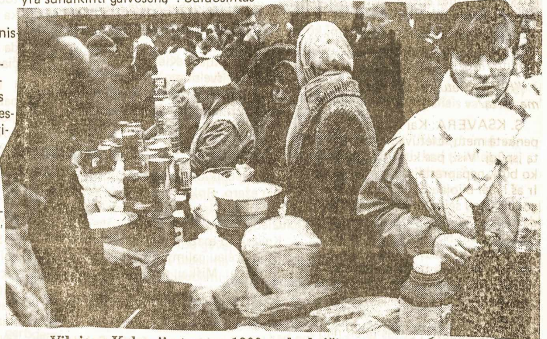
Vilniaus Kalvarijų turgus. 1992 m. lapkričio 17d.

Biudžeto deficitas sukelia infliaciją, kurią reikia mažinti. Bet dėl deficito neįmanoma tai padaryti. Slegiant didelei infliacijai, užkertamas kelias investicijoms. Verslininkai, galvodami apie naudą, turi suprasti, kad ji būsianti didesnė, jei aplinka taps turtingesnė. Keistai atrodo kai kurių seimo deputatų pažadai "mažinti mokesčius ir gerinti socialinę rūpybą". Mąstančiam žmogui turėtų būti aišku, kad tai neįmanoma.