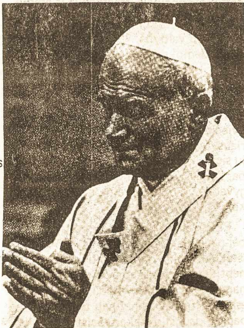
POPIEŽIUS JONAS PAULIUS II

Lietuvių tautos per amžius nueitas kelias buvo išmėginimų ir kančios kelias, paženklintas kova dėl neretai užtemdomos tapatybės išlaikymo, kelias, nužymėtas tėvynės kankinių, kurie daug buvo ir katalikų tikėjimo kankiniai. Ypač gyvai ir skaudžiai prisimename paskutinius dešimtmečius, per kuriuos Lietuva buvo nusiaubta dviejų ideologijų, pasišovusių Europai ir pasauliui primesti gyvenimo sampratą, radikaliai priešingas žmogaus pašaukimui į religinę ir pilietinę laisvę. Atmintyje mes sergime neapsakomas kančias daugelio vyskupų, tūkstančių kunigų ir tikinčiųjų, intelektualų ir politikų, darbininkų ir žemdirbių, ištisy šeimų, – visi jie buvo ištremti tam, kad negrįžtų. Daugelis iš jų priklauso didžiai persekiojamųjų dėl tikėjimo miniai. Istorija taip pat neturėtų užmiršti žydų bendruomenės, ypač Vilniuje ir Kaune, tragiško likimo; juos dėl žiaurais rasizmo norėta nušluoti nuo žemės veido. Reikia priminti, kad ši jūsų krašto vaikų bendra pražūtinga lemtis buvo surašyta neteisingumo paktuose, o jų slaptumas turėjo pridengti jų niekšišką pobūdį.