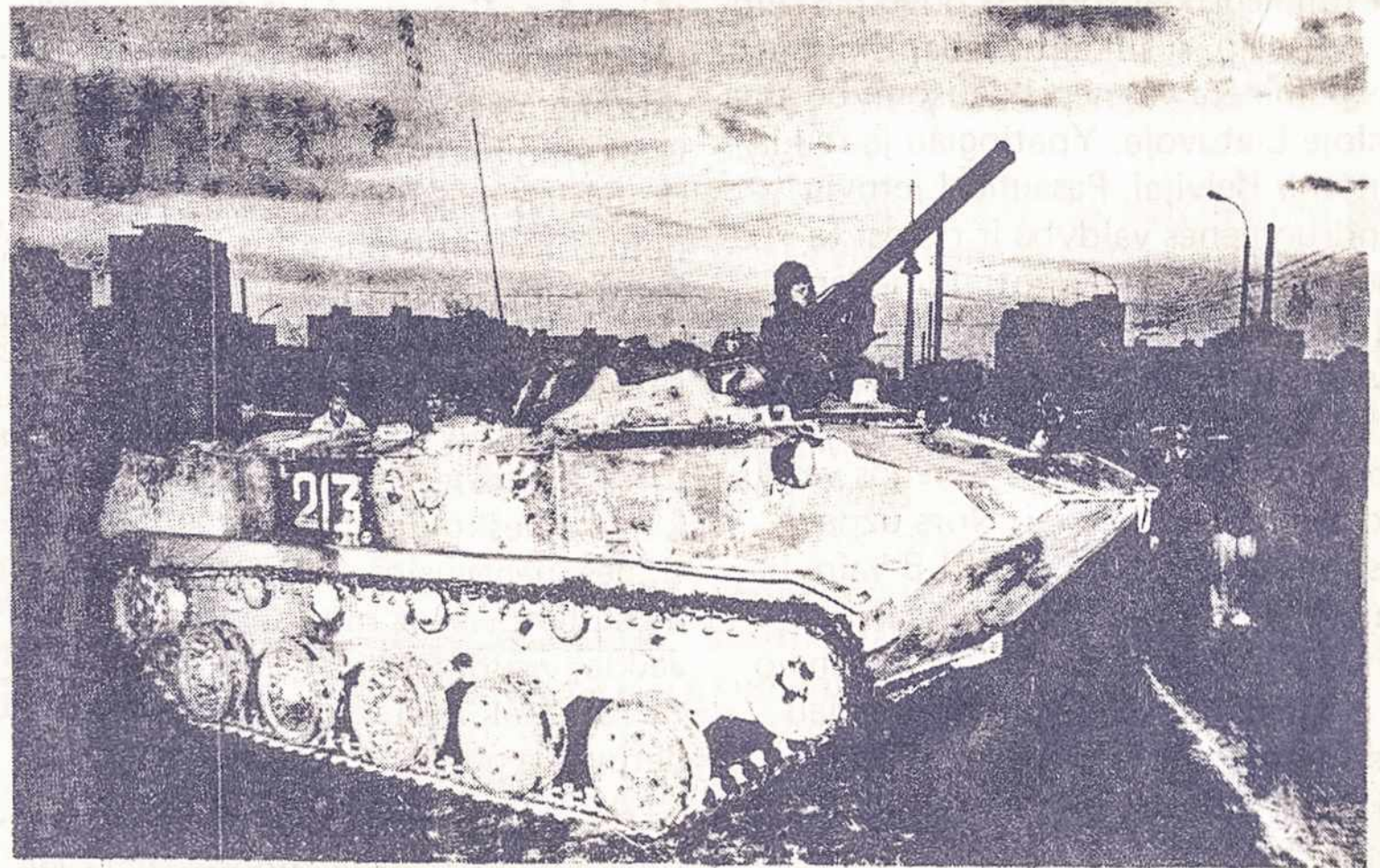
Sov. armijos tankas puola Spaudos rūmus 1991 sausio 11 d. Vilniuje.

— Mes nelabai palaikom ryšius, nes kiekvienas turim savo darbą, savo užsiėmimą. Ir man dabar, pavyzdžiui nie-