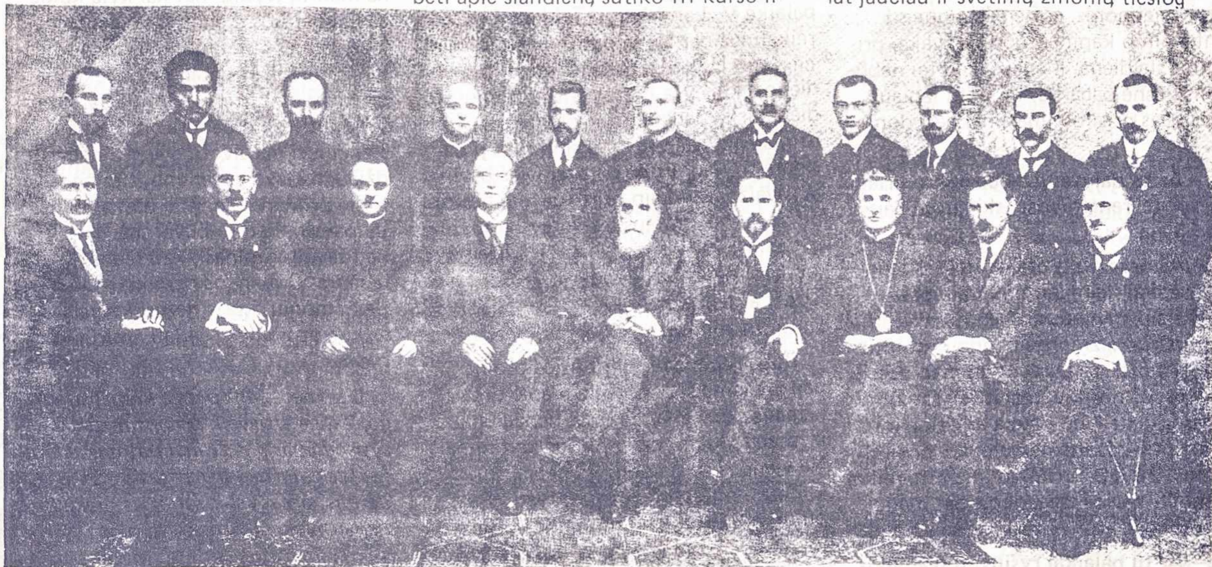
PIRMOJI LIETUVOS VALSTYBĖS TARYBA

– Kai atsipeikėjau, siaubingai išsigandau, kad nematau. Tai buvo pirmasis mano pojūtis. Antras įspūdis, kai pradėjau suvokti aplinką, buvo džiaugsmas, kad išėjau iš tos košmariškos besąmonės būklės, kad galiu galvoti apie save. Dar sužinojau, kad mano veidas buvo nudegęs. Visą laiką kankino mintis – kaip aš atrodau, bet negalėjau matyti. Pradėjęs vaikščioti, priėjau prie veidrodžio ir apstulbau – buvau beveik toks pat, kaip prieš sužeidimą, Raudonojo Kryžiaus ligoninėje manimi rūpinosi labiau, nei aš galėjau įsivaizduoti. Ypač malonūs man buvo gydytojai, tikri dvasios žmonės. Be to, nuolat jaučiau ir svetimų žmonių tiesiog