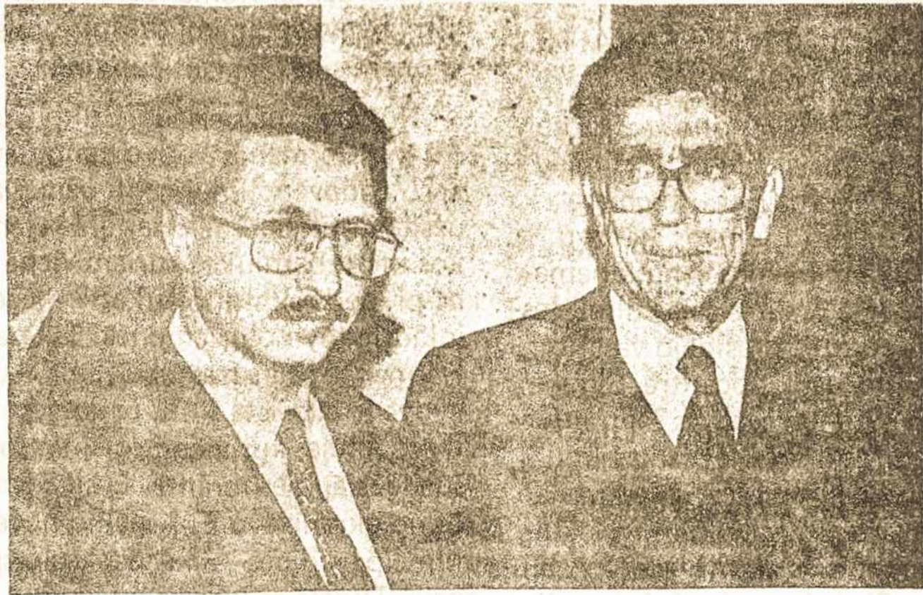
Lietuvos Krašto apsaugos ministras Audrius Butkevičius (kairėje) su Prancūzijos Gynybos ministru Pjeru Žoksu.