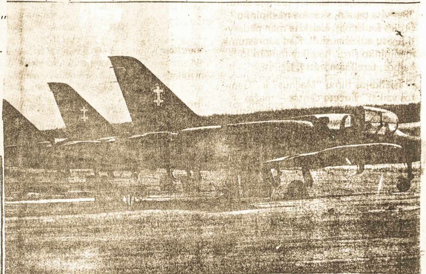
Lietuviška simbolika jau papuošti pirmieji keturi Lietuvos Respublikos karinių oro pajėgų reaktyviniai lėktuvai. Tai buvusioje Čekoslovakijoje pagamintos L-39 "Albatros" tipo karinės mašinos. Jas Lietuva nusipirko iš Kirgizijos.

Briuselio konferencijoje pagrindinis pranešėjas — V. Landsbergis. Konferenciją organizavo Europos politikos forumas. Ji skirta šalims, planuojantiems tapti bendrųjų Europos namų — Europos bendruomenės narėmis. V. Landsbergis pranešime klausė: "Nejaugi Europa vėl užleistų Baltijos šalis Rusijai"? Teigė, kad "IMF ir pasaulio bankas pavėlavo pusmečiu", dėl to "pralaimi ne tik Baltijos šalys, pralaimi ir pati Europa. Gelbėkit nors Estiją".