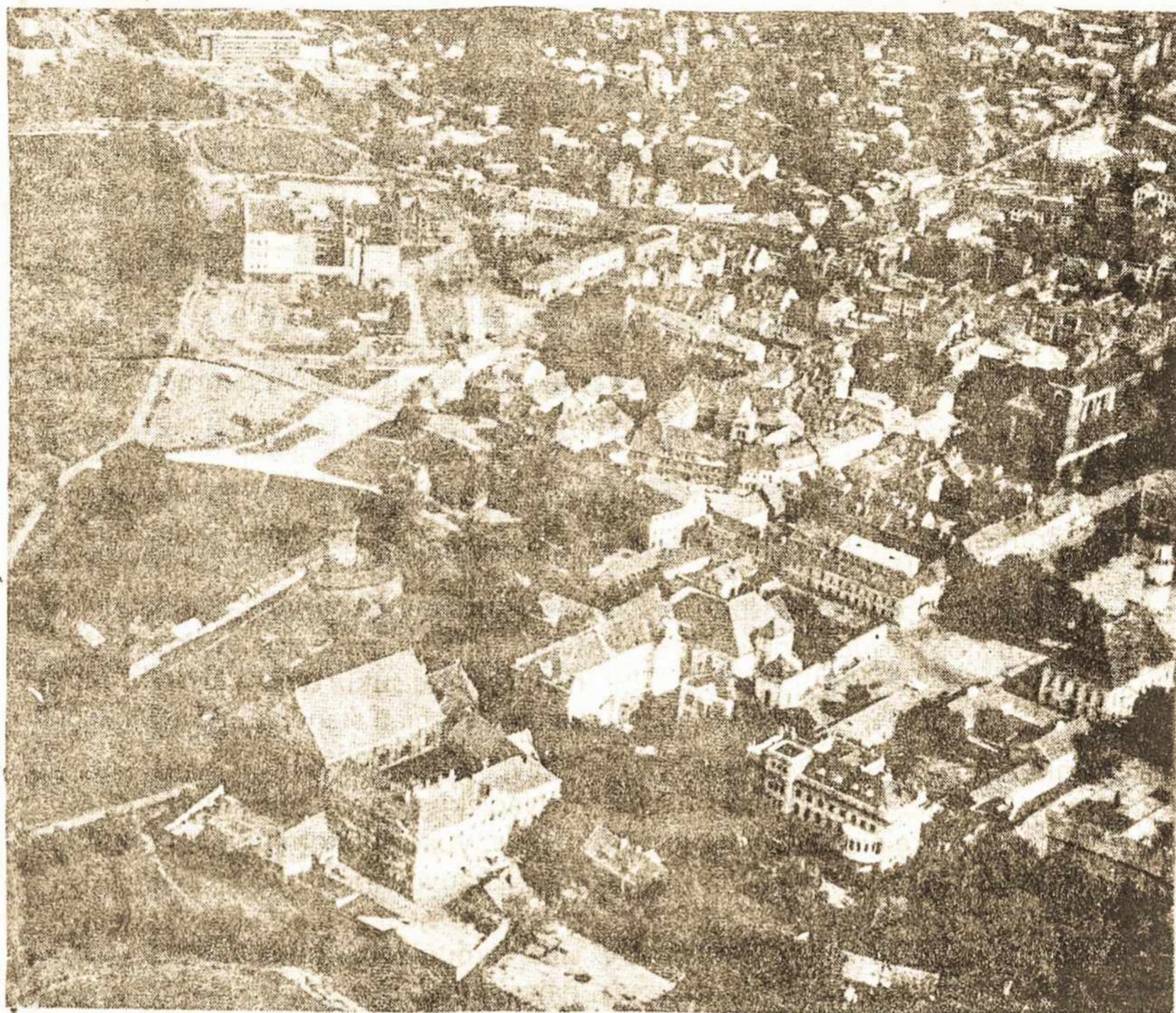
Kauno senamiestis iš oro. Kairėje - Kauno pilies likučiai ir tiltas per Nerį.

Kitaip yra su vidiniais ženklais. Jų slinktis daugeliui visai nematoma. Tik arčiau šios srities stovintys ar dar negausūs talkininkų būreliai iš šiapus Atlanto pastebi, kad tasai vidinis atstatymo būdas labai ir labai atsilieka, palyginus jį su išoriniu. Pasigirsta balsų, kad tie būdai, užuot vienas kitą papildę, ima kryžiuotis, dažniau atvejais pirmumą suteikiant išoriniam. Užuominos apie aukštųjų bokštų trumpinimą ir patalpų jaunimo veiklai statymą kai kuriose vietovėse susilaukia aiškaus nepritarimo. Ir kyla klausimas — negi bet koks išorinis ženk-