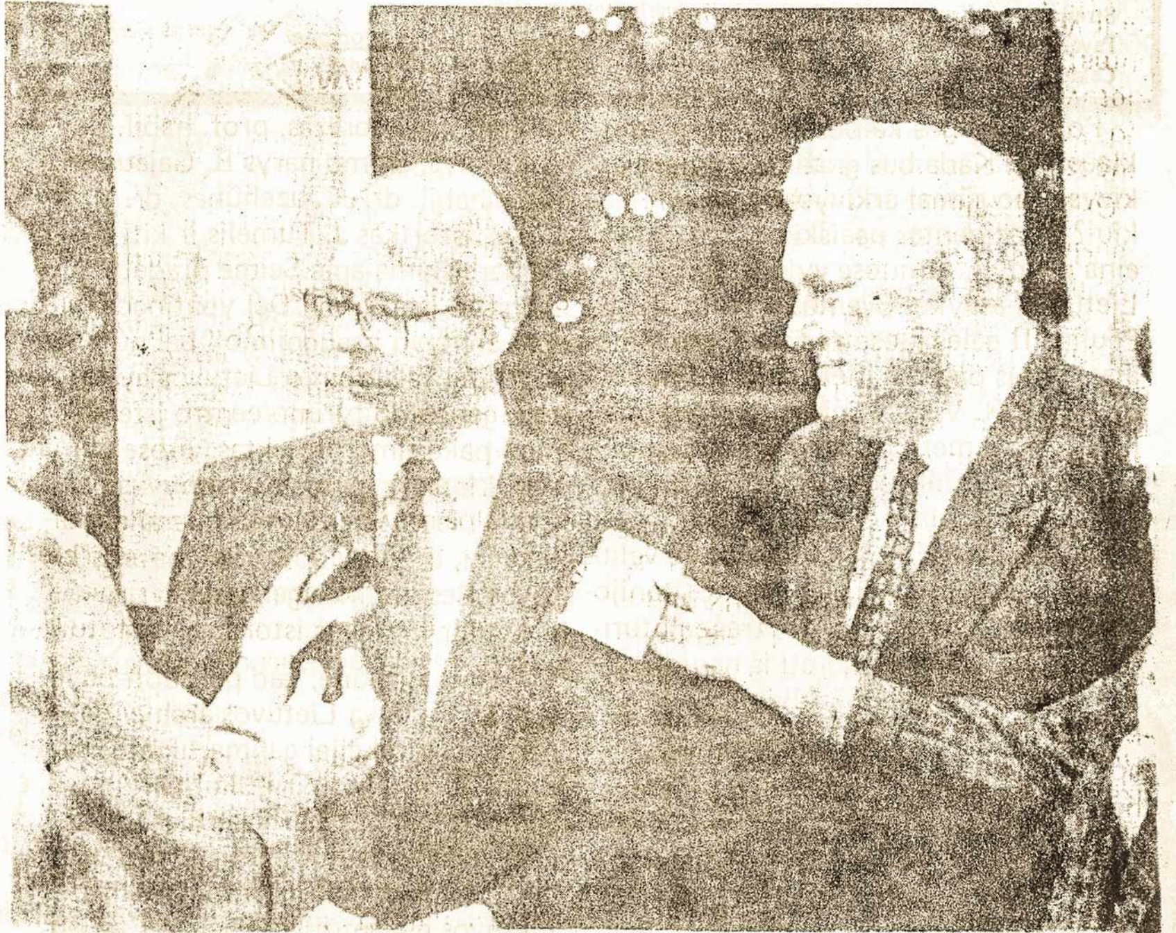
Lietuvos Respublikos Prezidentas Algirdas Brazauskas ir Didžiosios Britanijos ministras pirmininkas John'as Major'as po susitikimo duoda interviu žurnalistams.

Įvyko Lietuvos Prezidento ir jį lydinių asmenų susitikimas Europos rekonstrukcijos ir plėtros banke, senas bankininkystės tradicijas turinčiame