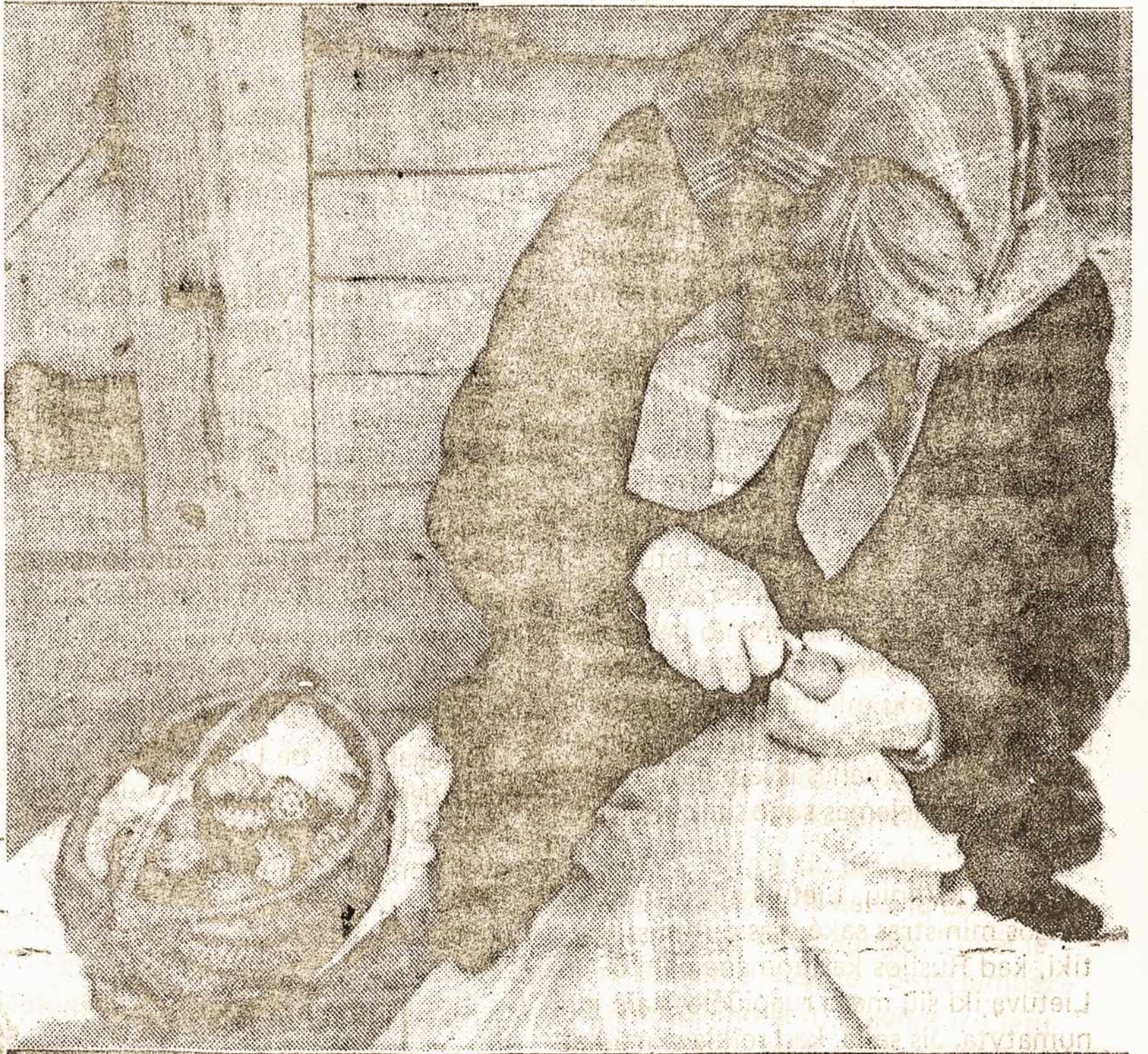
Lietuvoje vėl atgimsta tautinės bei religinės tradicijos...