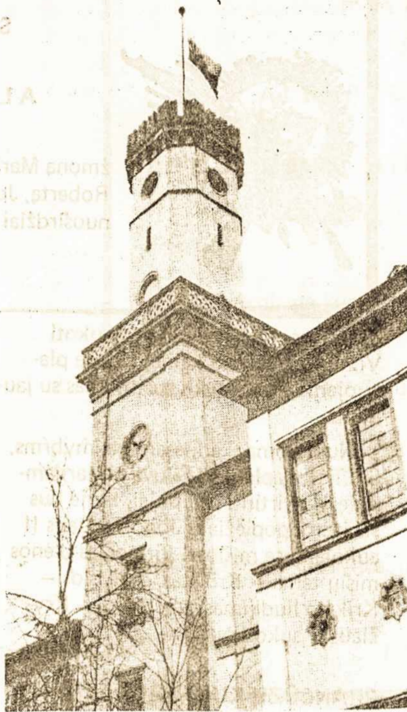
Vasario 16-sios Gimnazijos bokštas

Iki šiol gimnazijoje mokėsi 1.500 mokinių. Per paskutiniuosius 10 metų iš 500 mokinių 200 buvo iš Vokietijos, 300 iš užsienio valstybių. Skaičiai rodo, kaip pažymi direktorius, kad mokyklos išlaikymas neturėtų būti tik Vokietijos valdžios rūpestis, bet viso pasaulio lietuvių reikalas.