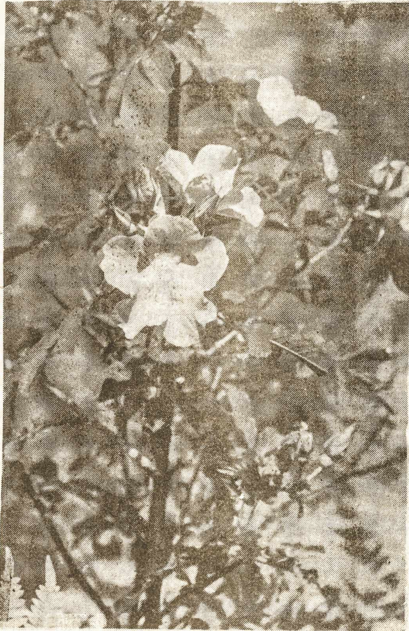
Tau, mamyte, šios gėlės, pražydusios Tavo kantrybės dėka

Tokiose palaidai propaguojamose gyvenimo būdo sankryžose nelengva jaunai moteriai pasirinkti — būti motina ar ne. Net ir pradėtbė jau dažnai atvejais nebesulaiko apsispręsti prieš motinystę. Tai pats skaudžiausias šių laikų klausimas, virstantis grūmojančiais žmogiškojo pavasario debesimis. Niekam moralinės skriaudos nesukeliantį išiečių yra, bet jomis pasinaudoti nenorima. Greičiausiai dėl to, kad trūksta iš gėrio išeinančios iniciatyvos tiek moterų, tiek ir vyrų tarpe. Nauja užkrečianti galvosena bresta