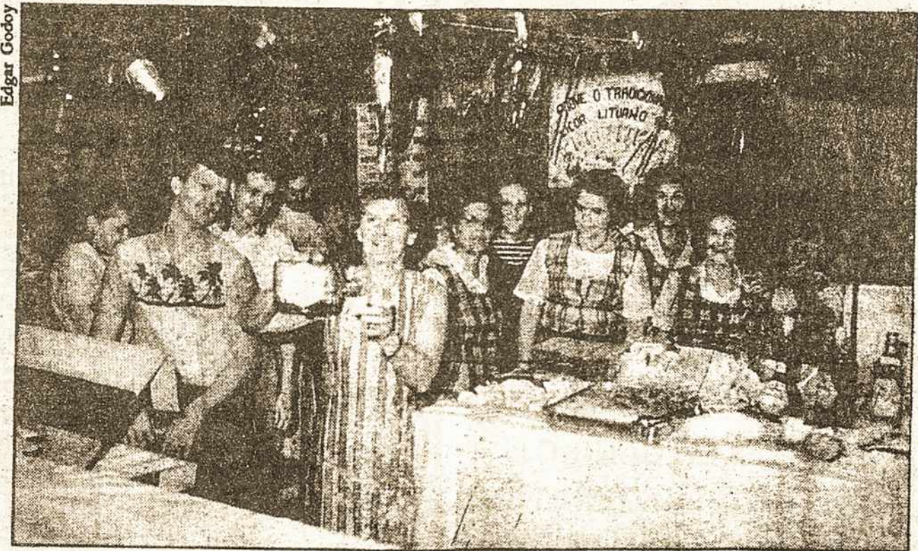
A barraca lituana, movida à krupnikas, agitou a festa