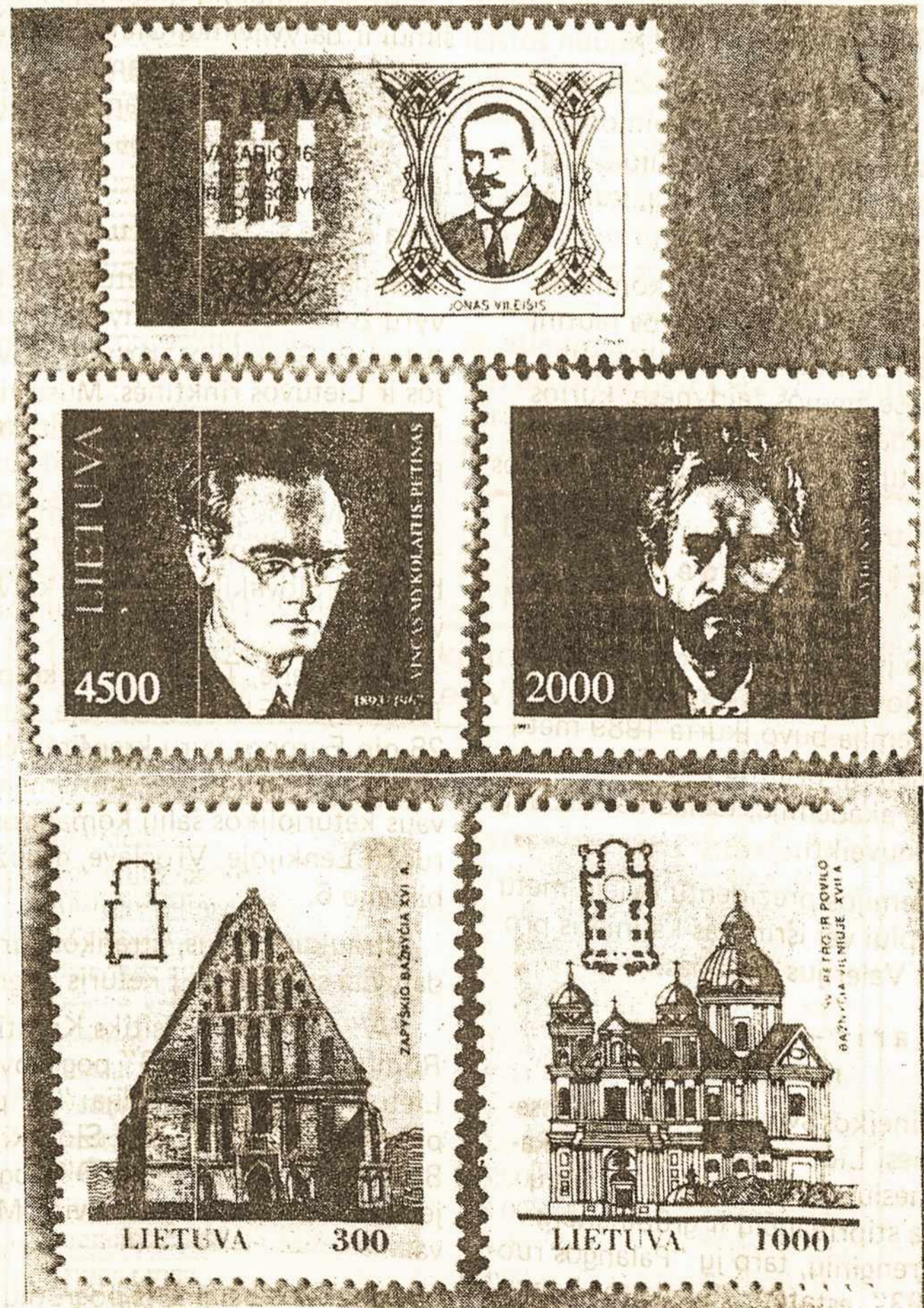
NAUJI LIETUVOS PAŠTO ŽENKLAI 1993 m.

• Lietuviškos spaudos rėmėjai yra savo tautos gynėjai