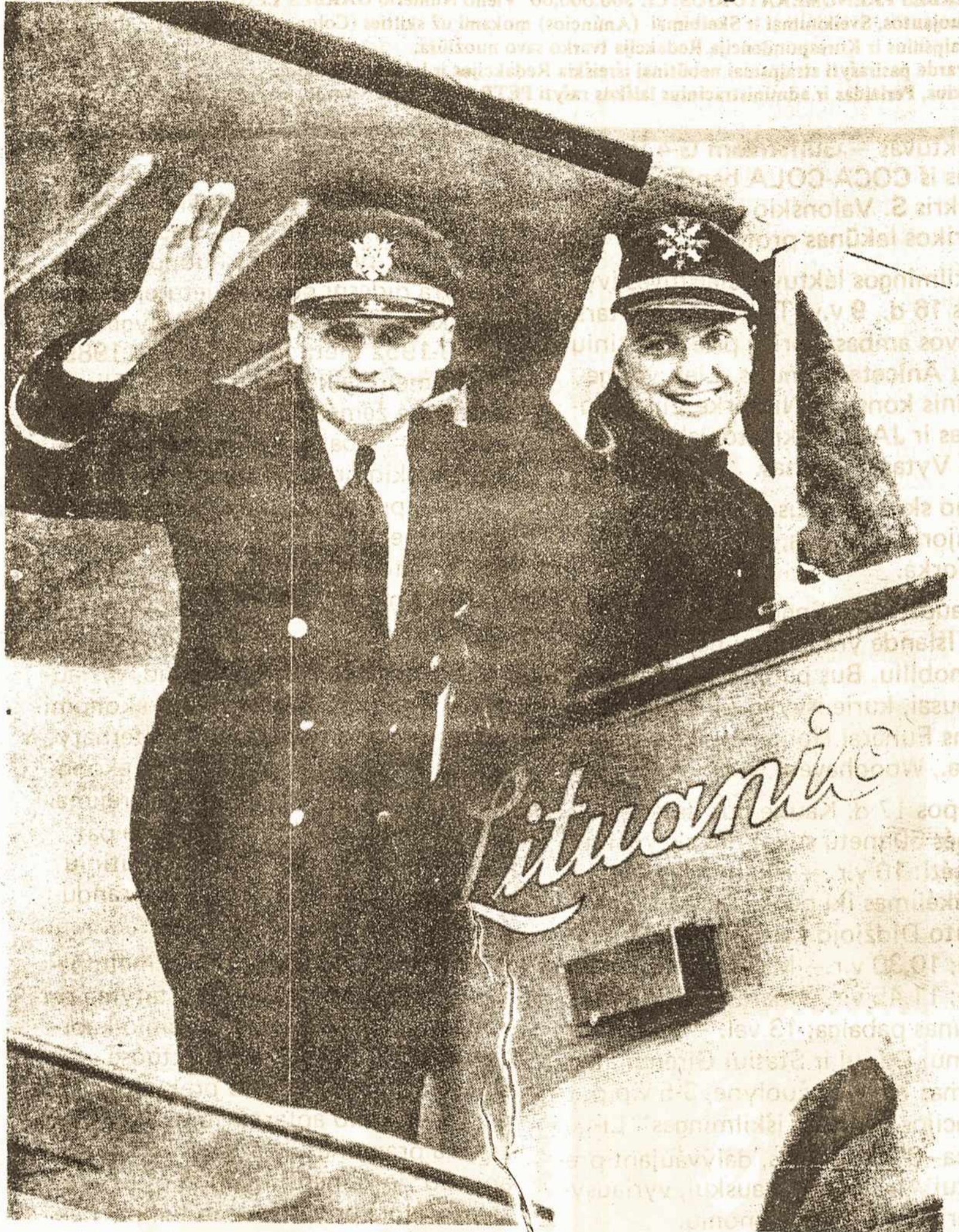
Iš dešinės : Steponas DARIUS Stasys GIRĖNAS

Steponas Darius, buvęs Lietuvos aviacijos lakūnas, dalyvavęs Klaipėdos išvadavime 1923 metais, narsus pilotas ir didelis idealistas, nusivylęs tėvynėje viešparaujančiais karjeristais sugrįžo į JAV, kur dalyvavo Vyties Aeroklube, ruošdamasis istoriniam skridimui į savo gimtą kraštą - Lietuvą, kurios, deja, nepasiekė, nors ir nugalėjo Atlantą. Tačiau jo ir Stasio Dariaus padarytas žygdarbis nepaliko be pėdsakų, nes jų virš atlantinio skridimas įrašė Lietuvos ir lietuvių vardą į tarptautinę didvyrių istoriją.