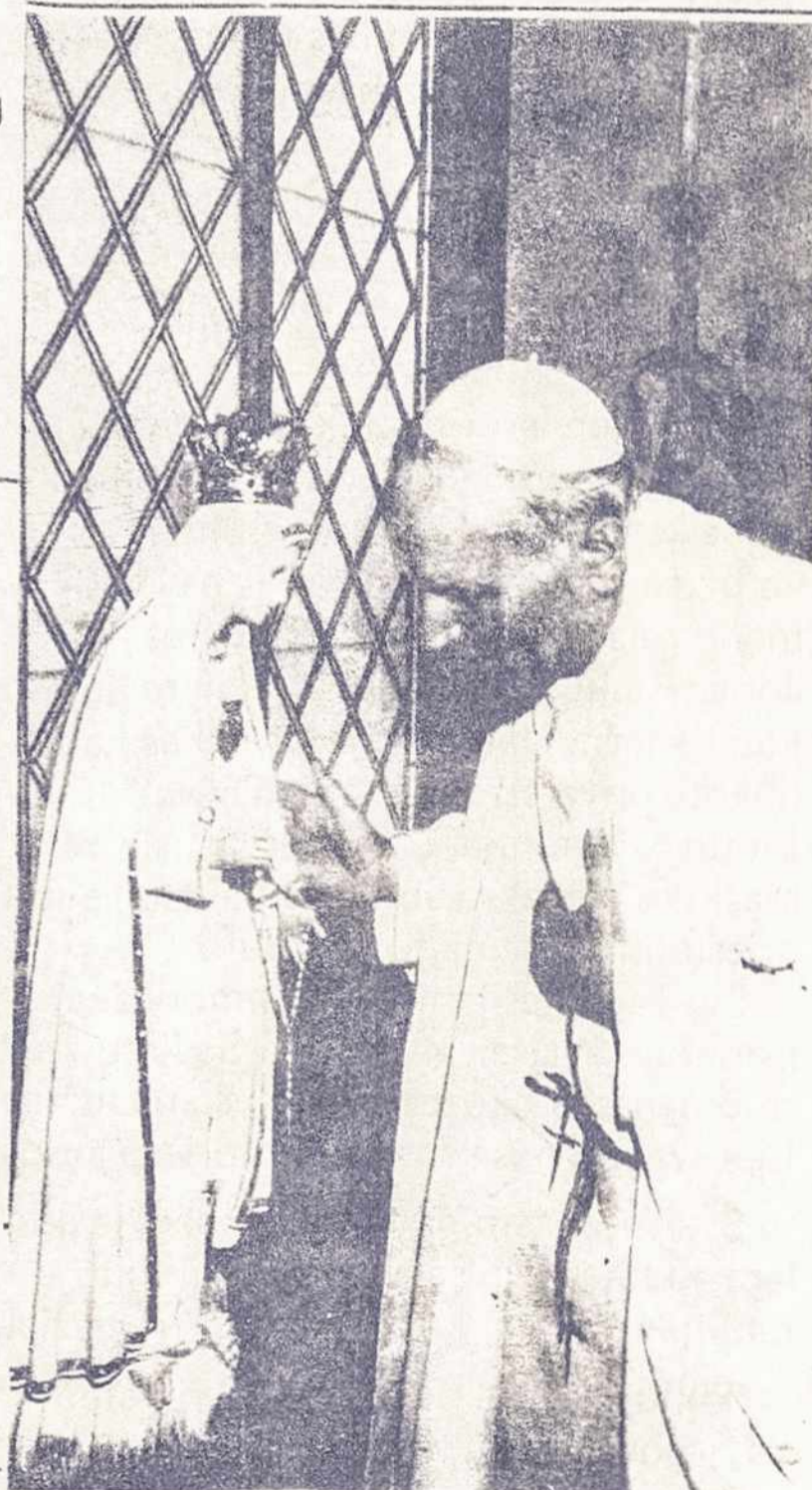
Popiežius JONAS PAULIUS II laimina Marijos statulą, kuri keliaus po pasaulį par Marijos metus (7.6.87–15.8.88)

PARDUODAME AUTOMOBILIAMS LIPINĖLIUS VĖLIAVĖLES RUA INACIO 671 - V. ZELINA