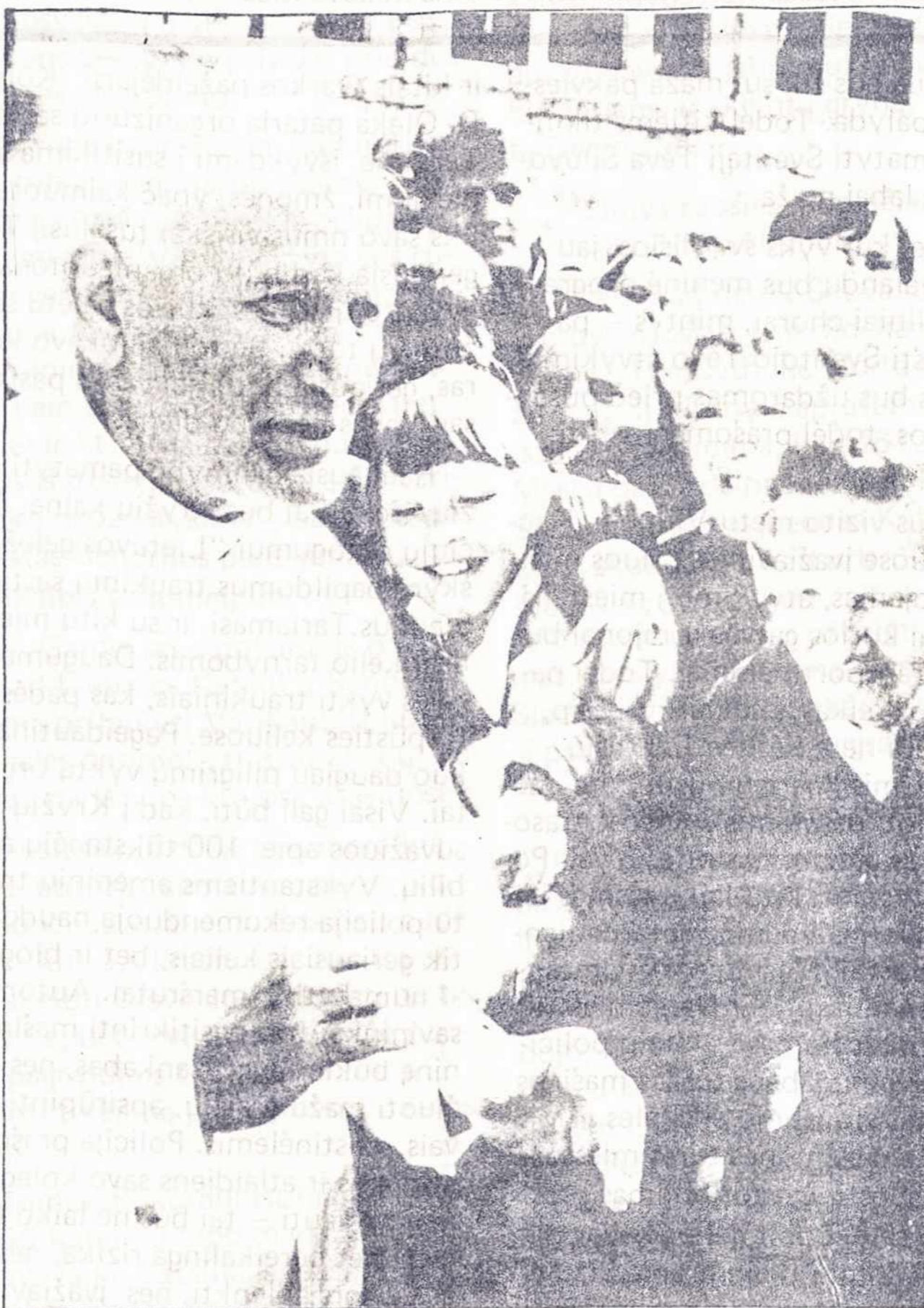
POPIEŽIUS JONAS PAULIUS II – LIETUVOJE. KUR GIMĖ JO MOTINA