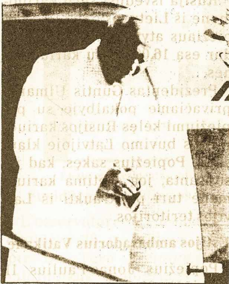
Paskutinės akimirkos Lietuvos žemėje.

KALBĖK LIETUVIŠKAI! CURSO LITUANO POR CORRESPONDÊNCIA F:635.975