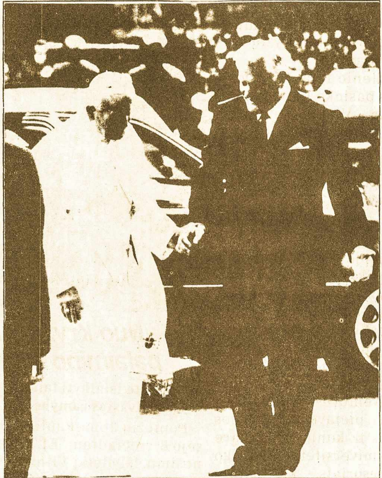
Lietuvos Prezidentas sutinka Jo Šventenybę prie Seimo rūmų.