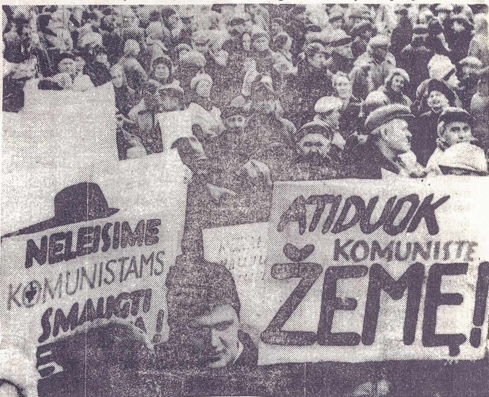
Šią vasarą pensininkai demonstravo dėl savo teisių prie vyriausybės rūmų

Neseniai Seimo kanclerio parengtame įstatymo projekte "Dėl