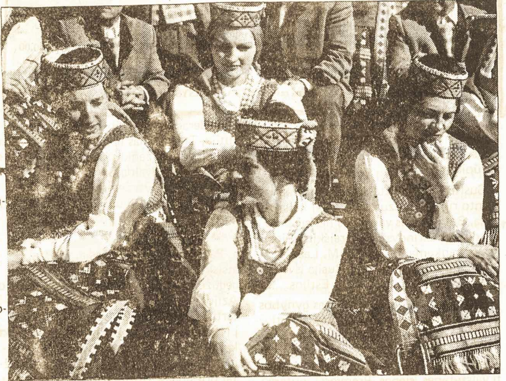
Nauji metai, naujos viltys, ypač žvelgiant į mūsų gražų jaunimą

Naujųjų metų linkėjimai turėtų kiekvieną stiprinti ir padrąsinti priimti viską, kas skirta, ir atmesti — kas silpnina dvasią. Nesvarbu kuriais žodžiais tai išreiškiama, kas juos ištaria ar parašo. Visa turėtų būti paversta dvasinei būsenai skaidrinti, nes nuo to labai daug priklauso naštos svoris, jų pakėlimas, nes jų buvimas ar nebuvimas. Daugelis šiandien skaudžiai pergyvena dėl mūsų tautos pasimetimo, pasikeitimo, moralinio nuosmukio, dėl valdžios bejėgiškumo ar nenoro stabdyti baisius nusikaltimų siautulius. Ne vienas, pavartęs Lietuvos spaudą, taria: ne prisikeliame, o žūstame. Tiesa, tai labai liūdna, bet ne beviltiška. Keisis žmonės, keisis valdžios ir laikai. Linkėtina tik būtų, kad tai greičiau įvyktų. Ne