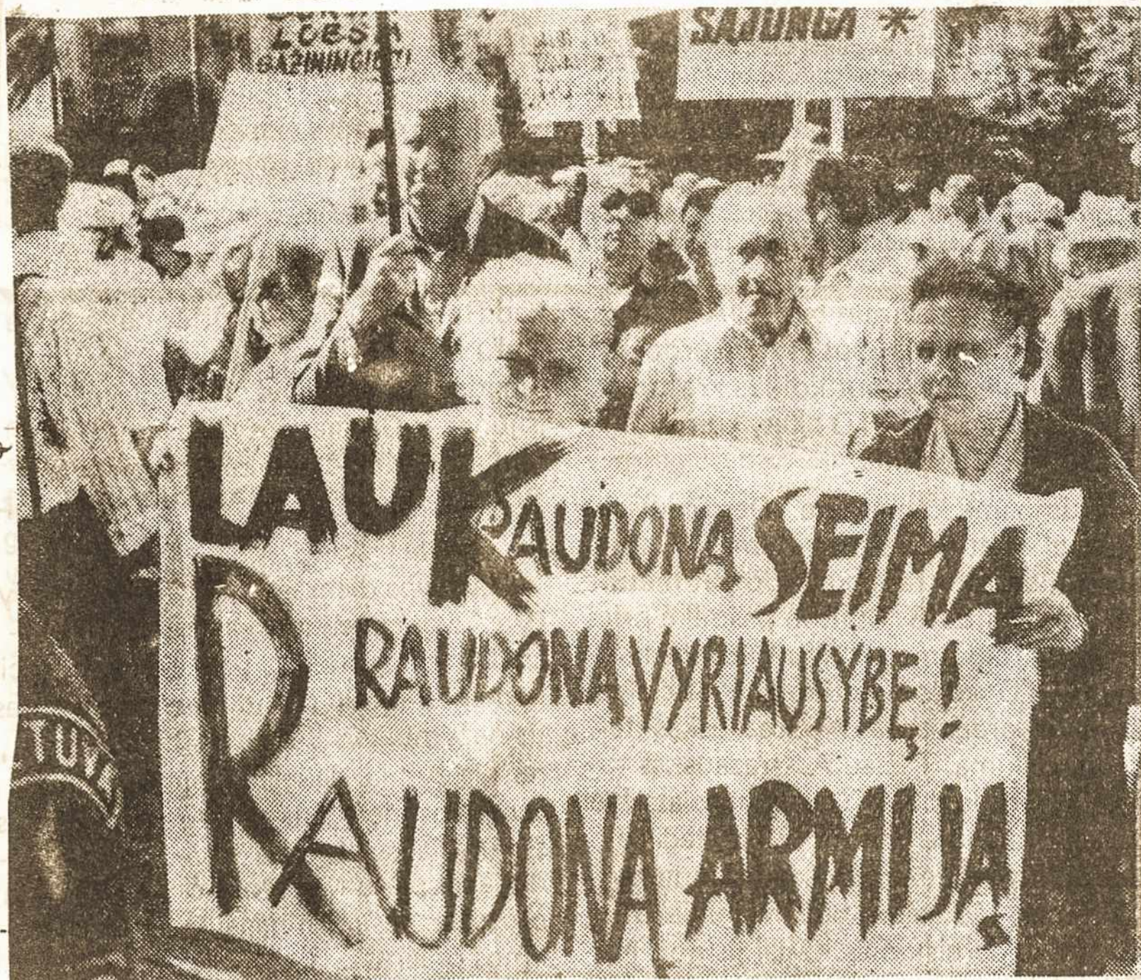
Prie Lietuvos Seimo rūmų demonstruotojai aiškiai išreiškia savo nuomonę

Vienintelis prablaivėjimas, atrodo – nauji rinkimai. Ar jie bus konstitucijos nustatyta tvarka, ar ankstyvesni, galima tik spėlioti. Tačiau kaip bebūtų ruošis jau dabar reikia. Normaliai po kiekvienų rinkimų jau ruošiamasi kitiems. Partijų sustingimas būtų jų pražūtis. Tik tas ruošimasis neturėtų būti kabinėtinis. Tikras ruošimasis yra platus išėjimas iki mažiausių vietovių, vienminčių ieškojimas ir telkimas, ir tai ne iševijoje, bet pačioje Lietuvoje. Suprantama, kad tai nelengvas uždavinys, kai nusivylę žmonės aplamai pradeda nebetikėti valdžia, kai ją žiūrima kaip į aukščiausio laipsnio sava-