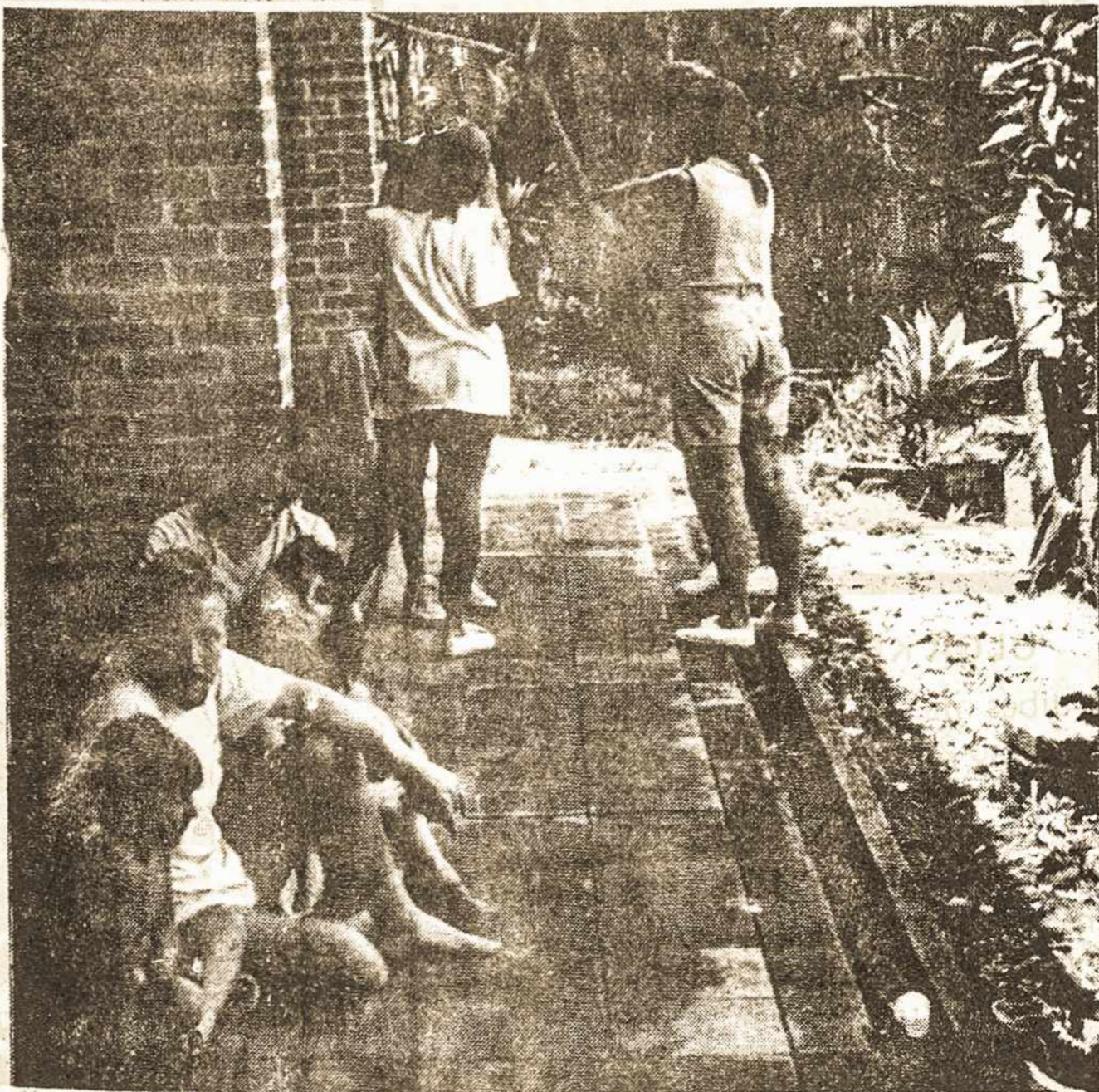
1993-94 m. gruodžio-sausio mėn. Pietų Amerikos lietuvių jaunimo suvažiavimo dalyviai (Brazilijos, Urugvajaus, Venecuelos atstovai) Litanikos sodyboje, 70 km nuo Sao Paulo