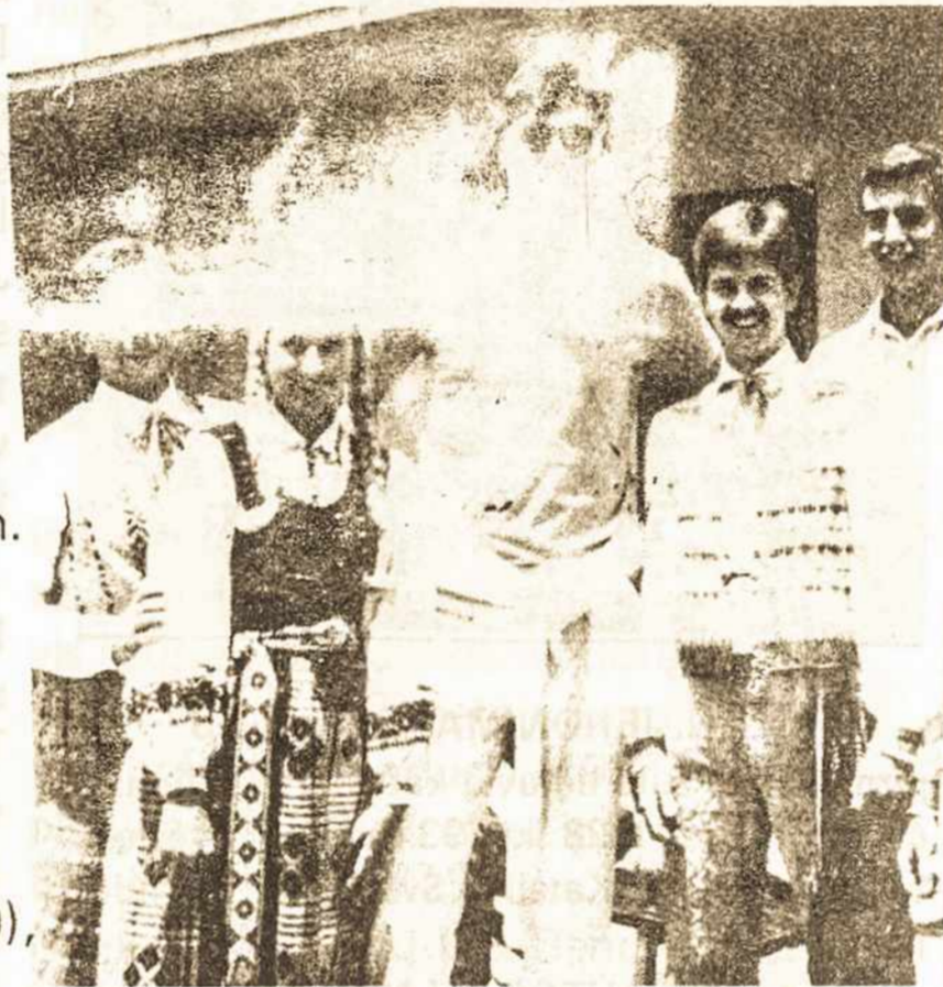
Arvydas Sabonis su Los Angeles lietuvių jaunimu...

Jau keliolika metų iš eilės vieno didžiausių Europos krepšinio leidinių "FIBA basketball" leidėjai organizuoja geriausių Europos krepšinininkų rinkimus. Iš viso buvo paminėtos 45 sportininkų iš 17 valstybių pavardės. Šįsyk geriausio krepšinininko titulą laimėjo Madrido "Real" komandos vidurio puolėjas Arvydas Sabonis. Kaip rašo "FIBA basketball" apžvalgininkas. "pernai ši Lietuvos ir viso pasaulio krepšinio žvaigždė liko antra – keliais balsais daugiau surinko Chorvatijos atstovas Tonis Kukočas. Ir štai – revanšas". Arvydas Sabonis surinko 183 balsus ir net 22 taškais aplenkė antroje vietoje likusį T. Kukočą (161), šiemet sužibėjęs NBA padangėje.