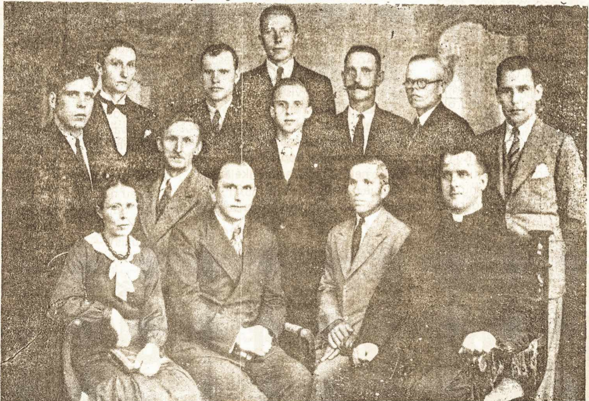
LIETUVIŲ ROMOS KATALIKŲ ŠV. JUOZAPO BENDRUOMENĖS VALDYBA 1932 METAIS

Negausus susirinkimas laukia naujojo kapeliono ir kartu Bendruomenės pirmininko žodžio. Ar jis guos, ramins ar išbaręs paliks pakrikam likimui? O