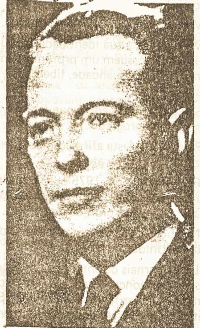
ANTANAS ŠABANIAUSKAS garsiausias Lietuvos pramoginės muzikos artistas naujai įgrotoj jo gražiausių interpretacijų juos telėj. "MŪSŲ LIETUVA".