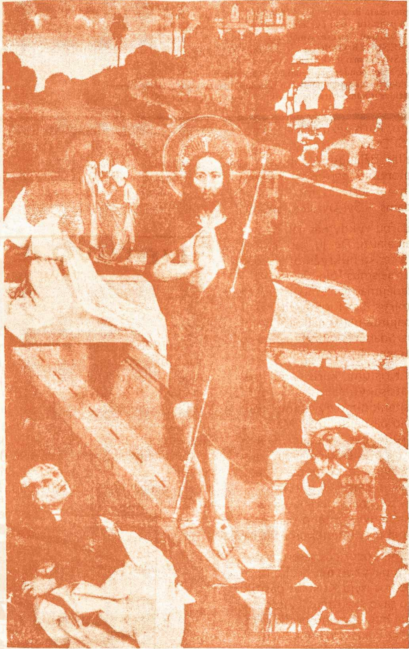
Hans Pleydenwurff (ca. 1420-7 1472) Alte Pinakothek, Muenchenas, Vokietija

Bet antrą prisikėlimo prasmę galime patirti dar žemėje gyvendami. Antrame skaitinyje (Romiečiams 8:8-11) šv. Paulius mums primena: "Jumyse gyve-