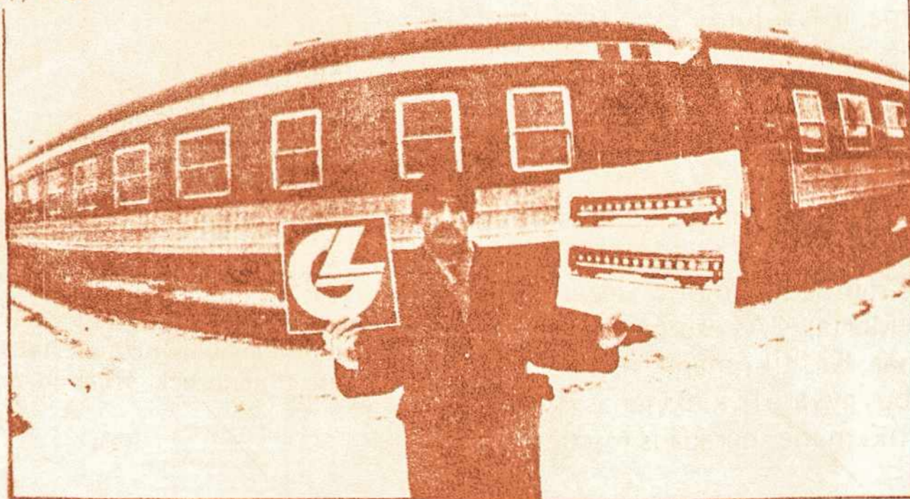
Prieš pat Naujuosius metus iš Lenkijos Bidgošč vagonų remonto depojų į Lietuvą grįžo trys seni vagonai. Pagal dizainerio Liudo Gedmino projektą jie dabar tviška ryškiomis spalvomis ir, svarbiausia, tapo patogūs keleiviams, juose 54 vietos. Šiais metais iš Lenkijos grįš dar 40 suremontuotų vagonų.

Šių metų pradžioje Lietuvoje gyventojų buvo 3.739.000, skelbia BNS ir ELTA – 12.000 mažiau negu 1993 m. sausio 1 d. Nuo 1990 m. sumažėjęs gimstamumas ir santuokų skaičius, o padidėjęs mirtinumas. Mirė nuo kraujo apytakos ligų – 54% visų mirusių, nuo vėžio 16%. Pakilęs savižudybių skaičius ir apsinuodijimų alkoholiu. Migracijos pakitimas paveikė Lietuvos tautinę sudėtį: per paskutinius penkerius metus išvyko iš viso 96.000 gyventojų – rusų, žydų, gudų ir ukrainiečių, atvyko daugiau lietuvių (100.000) ir lenkų (3.500), RSJ