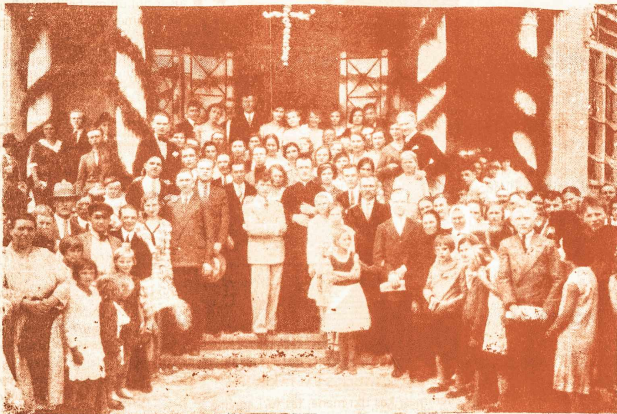
Lietuviškos koplyčios pašventinimas 1931 metų gruodžio 25 dieną Vila Belos lietuvių mokyklos namuose