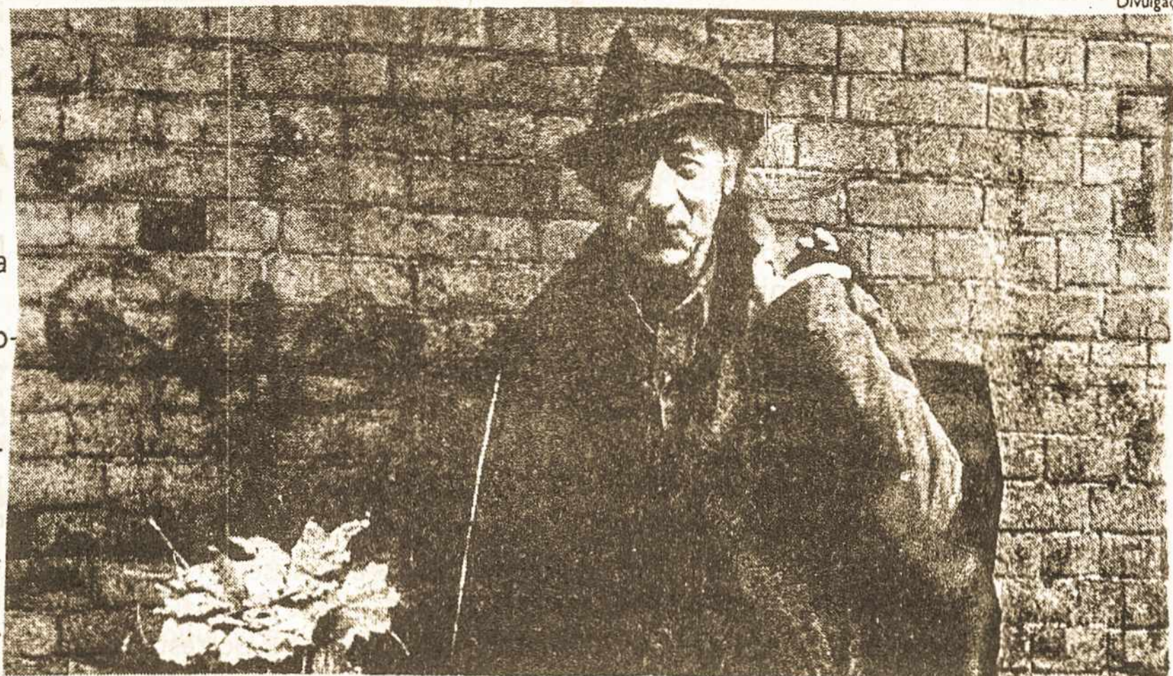
ista norte-americano Jonas Mekas, que esteve em São Paulo para a 17ª Mostra

Mekas: Aš užaugau mažame miestuke, tėvai buvo žemdirbiai – ten kino nebuvo. Pirmą kartą mačiau kai man buvo 16 metų. Mano tikras ryšys su kinu prasidėjo po karo, kai buvau pabėgėlių stovykloje Wiesbadene (Vokietijoje) ir pradėjau studijuoti filozofiją ir literatūrą Mainz Universitete. Ten mačiau pir-