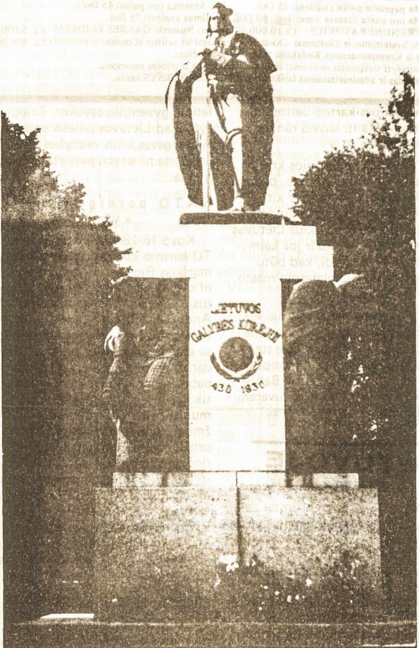
Šis skulptoriaus V. Grybo paminklas DLK Vytautui, stovėjęs Kauno Aukštosios Panemunės kareivinėse, buvo sunaikintas. Pagal išlikusį gipsinį modelį skulptūra vėl atkurta ir pastatyta Laisvės alėjoje prie miesto savivaldybės.

Didžiųjų rūpestį kelia Rusijoje iškilęs diktatoriškų polinkių asmuo, jau pavadintas "Rusijos Hitleriu" – Vladimir Pironovskis, prezidentinių rinkimų metu laimėjęs ketvirtadalį balsų ir tapęs labai rimtu Jelcino konkurentu. Žiri-