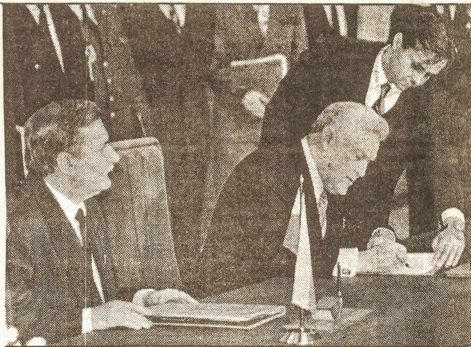
enckijos Prezidentas L. Walesa ir Lietuvos Prezidentas A. Brazauskas pasirašo draugiškų santykių gero kaimyninio bendradarbiavimo sutartį.

Statistikos skyrius taip pat tvirtina, jog per pirmąjį 1994 m. ketvirtį kainos kilo tik 3,7% per mėnesį, daug mažiau, negu pernai per tą patį laikotarpį. Daugiausia per šį laikotarpį pabrango sveikatos priežiūra ir medicinos paslaugos (20,9%), mažiausiai – transportas ir ryšiai (2,9%). Maisto prekių kainos padidėjo 12,1%, drabužių ir avalynės – 12%, būstas, kuras ir energija – 10,8%, namų ūkio reikmenys ir paslaugos – 9,7%. Lietuvoje kainų kilimas šiame ketvirtyje lėtesnis, negu Estijoje ir Gudijoje, tačiau pralenkęs Latvijos infliaciją (1,7%).