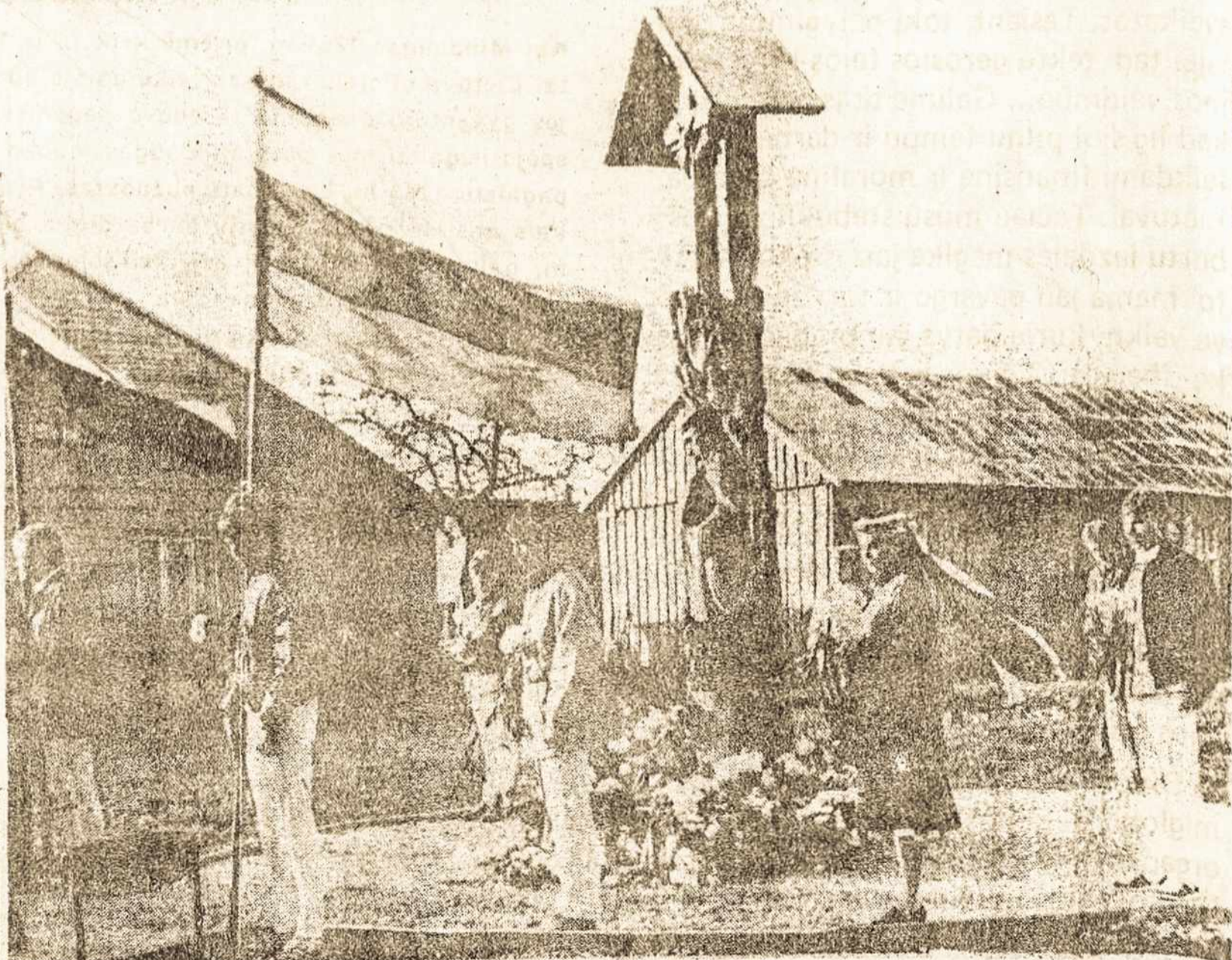
Žuvusiems už Lietuvą tremtyje ir tėvynėje 1940-1953 metų laikotarpiu paminklo atidengimo iškilmės Kvėdaruose, Šilalės rajone. Šioje vietoje būdavo išmetami nužudytųjų kovotojų lavonai

Niujorke į Šv. Pranciškaus vienuolyno įsibrovę plėšikai ir pagrobė iš seifo neturteliams maitinti surinktus 78.000 dol. Lėšos taipgi buvo panaudojamos AIDS pacientams globoti. Miesto meras D. Dinkins giliai atjautė tą skriaudą ir paraginti geradariai per dvi savaites versuaukojo 78.000 dol.