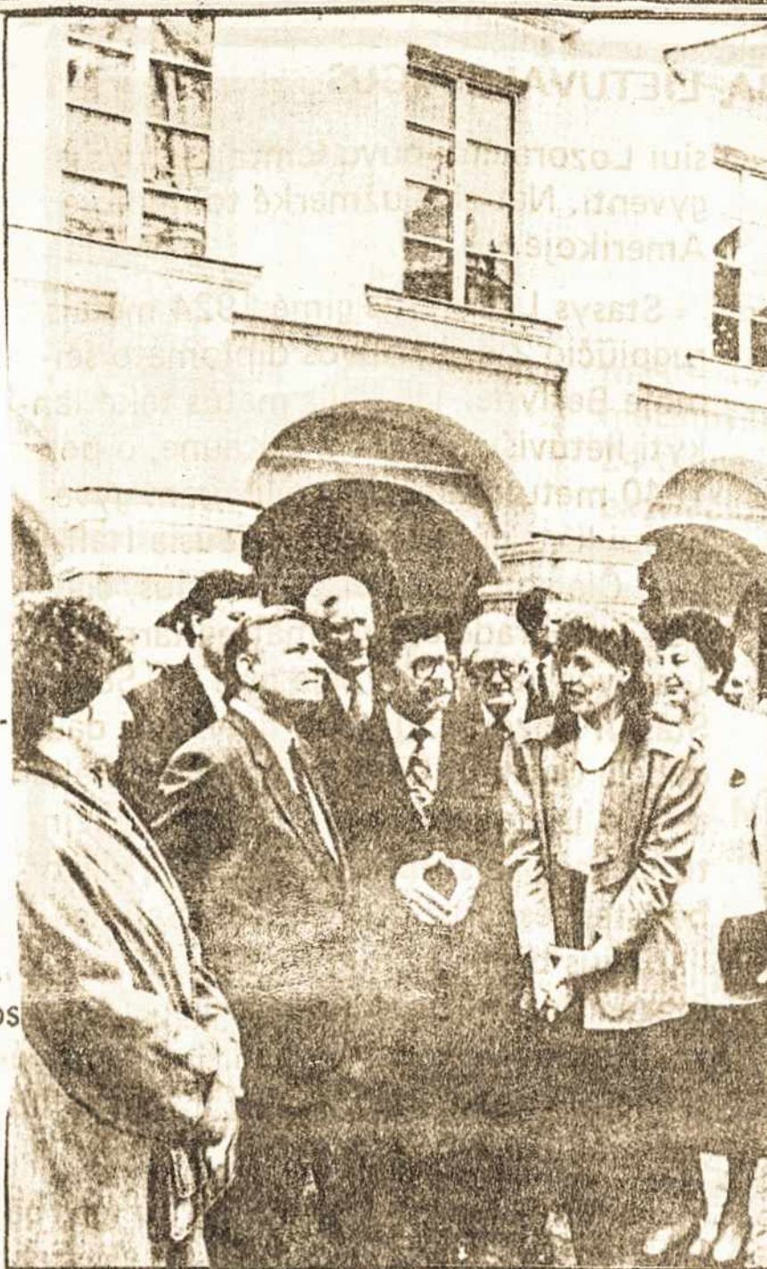
Lenkijos prezidentas Lech Wałęsa su žmona Danuta Wałęsa ir juos lydėję asmenys Vilniaus universitete.

Lietuvių pusėje nepasitenkinimas kilo todėl, kad sutartyje nebuvo paminėtas Želigovskio smurtas, kuriuo buvo