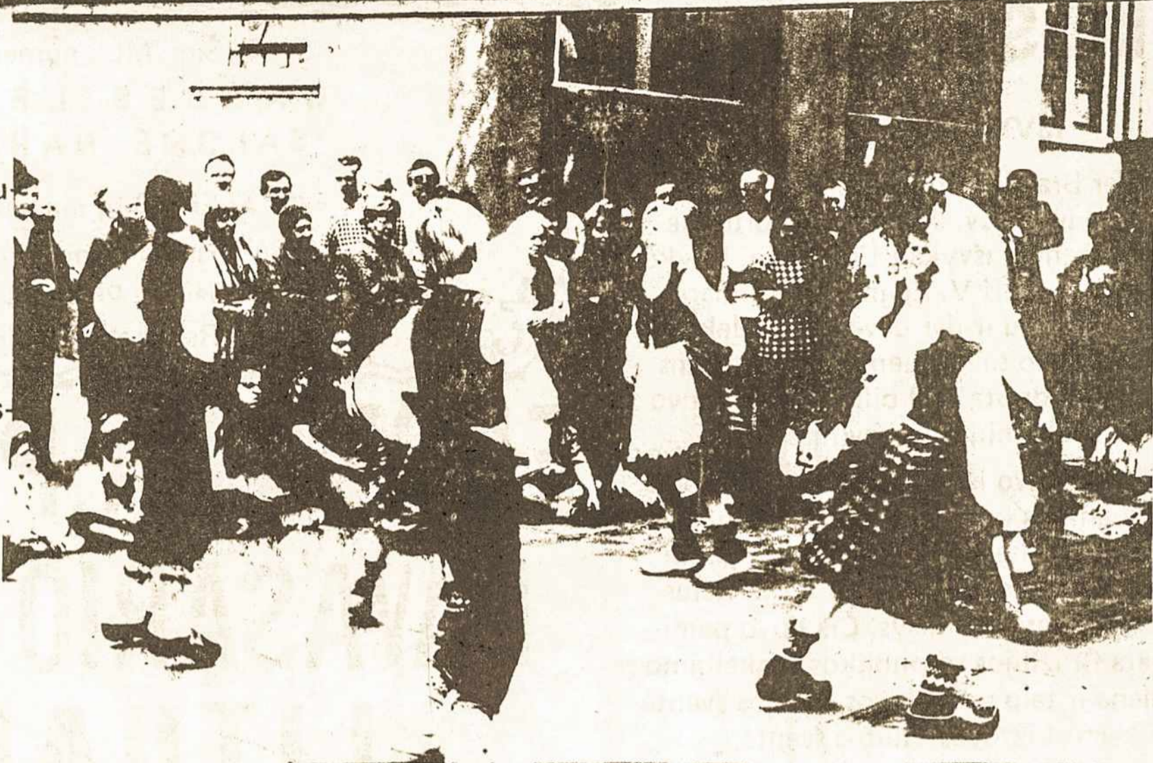
VAIKŲ TAUTINIŲ ŠOKIŲ ANSAMBLIS "NEMUNĖLIS" iš Kauno pasirodo V. Zelinoj prie jaunimo namų šokdami su klumpėmis