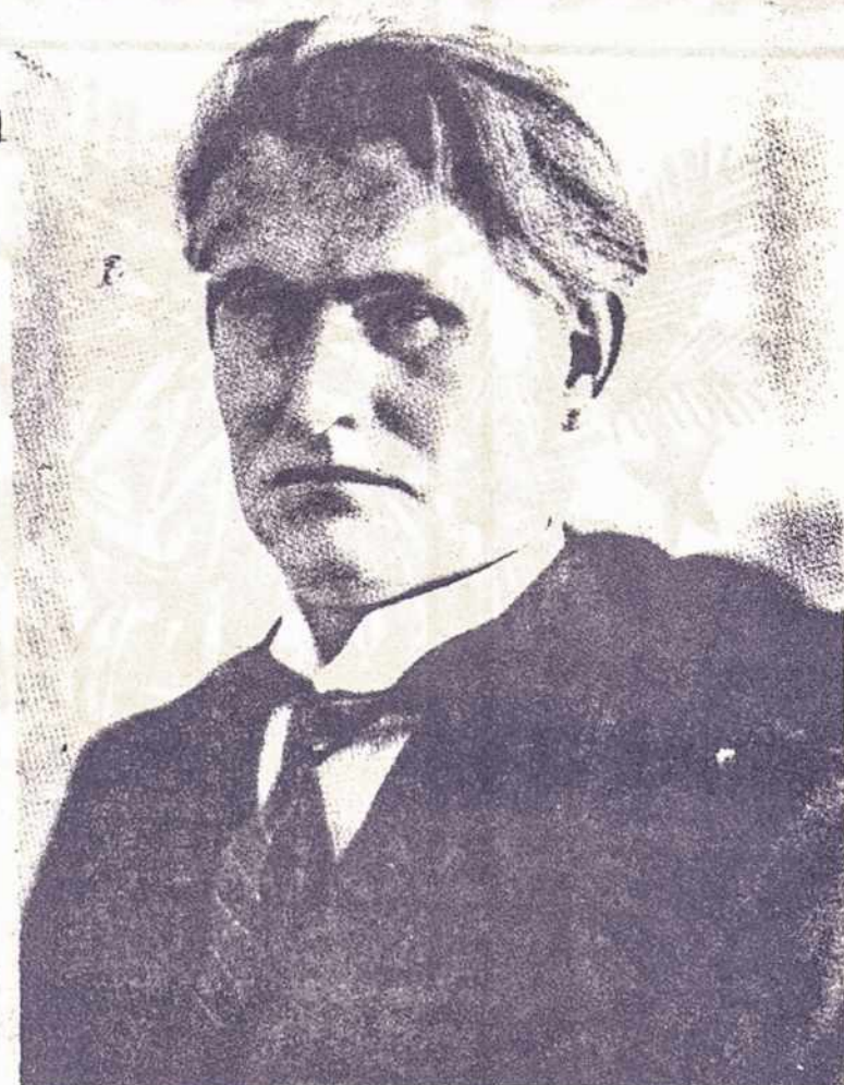
Kazys GRINIUS (1866 - 1950)

Vilniun iš Čikagos spalio 7 d. atskraidinta urna su trečiojo Lietuvos prez. dr. Kazio Griniaus (1866-1950) palaikais atsisveikinti norintiems vilniečiams buvo išstatyta Lietuvos seimo rūmų priešakyje. Tos dienos seimo narių posėdis buvo skirtas velionies atminimui. Oficialioji perlaidojimo dalis spalio 8 d. prasidėjo urnos nuvežimu Kaunan prie ten buvusios Lietuvos prezidentūros. Ji taipgi buvo atlydėta velionies gimtąjan Selemos Būdos kaiman ir perlaidojimui pasirinkton Mondžgirėn