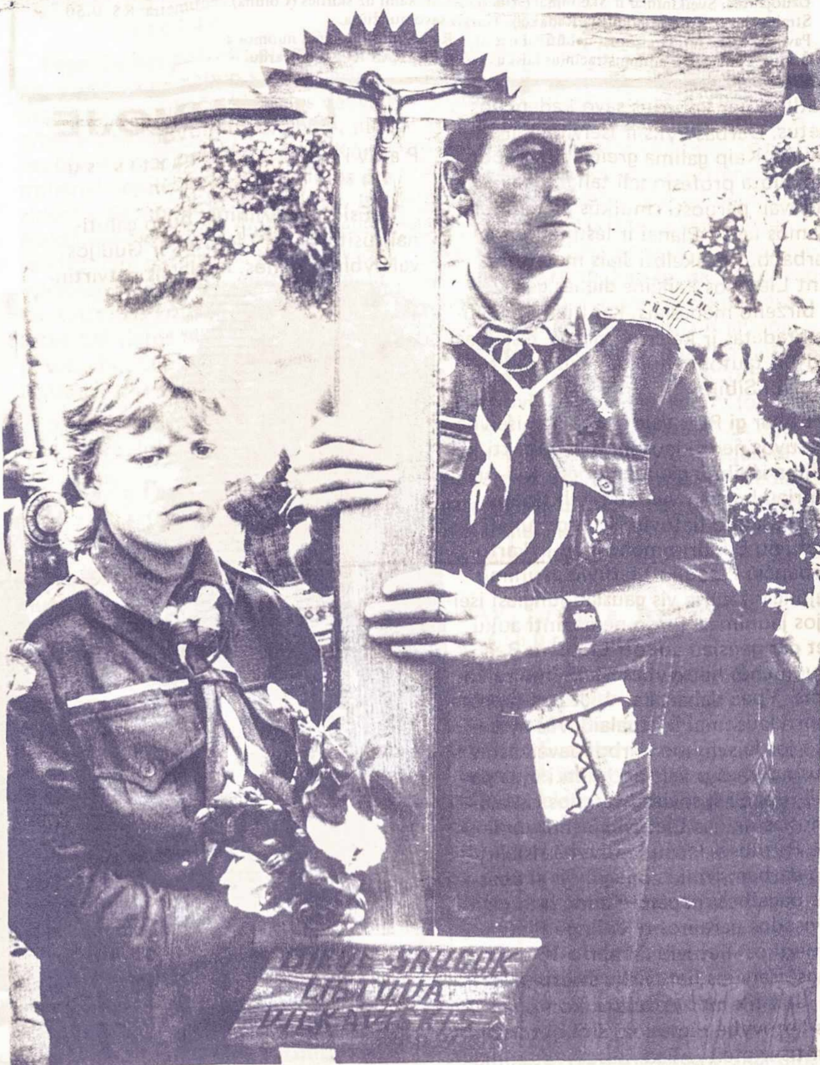
“Nepriklausomybės ir vilties žygis — skautai žygiuoja.

Okupacijos sąlygomis toks užmojis tegalėjo būti tik svajonė. Bet dabar okupacija pasibaigė. Lietuva laisva ir