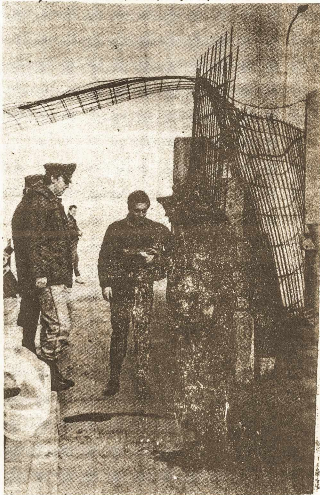
Šiaulių postas prie ėjimo į Lietuvos parlamento rūmus 1991 sausio kruviniųjų įvykių metu

Toliau V. Landsbergis sako, kad Rusijos reikalaujama ypatinga sutartis, kelia naujus pavojus Lietuvai, o Lietuvos Užsienio reikalų ministerija per mažai rūpinasi pavojams pašalinti.