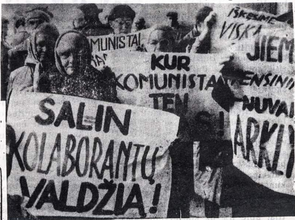
Prie Seimo rūmų pensininkai demonstruoja, reikalaudami padidinti pensijas.