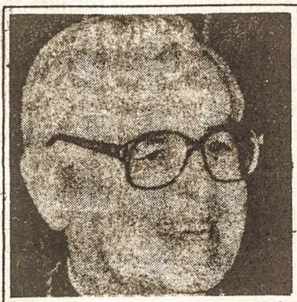
DOM PAULO EVARISTO ARNS

Siemet S. Paulo kardinolas Dom Paulo Evaristo Arns švenčia auksinį kunigystės jubiliejų, o taip pat 25 metus, kai yra S. Paulo arkivyskupijos valdžioje. S. Paulo vyskupija taip pat švenčia 250 metų nuo jos įkūrimo. Šiems visiems jubiliejams atžymėti pirmiausia bus šventkelionė į APARECIDA sekmadienį, gegužės 28 dieną, kurioje dalyvaus visų arkivyskupijos parapijų atstovai. Kardinolas bus taip pat pagerbtas per Dievo Kūno šventę miesto centre – Anhangabaú birželio 15 dieną, 9 val. ryto.