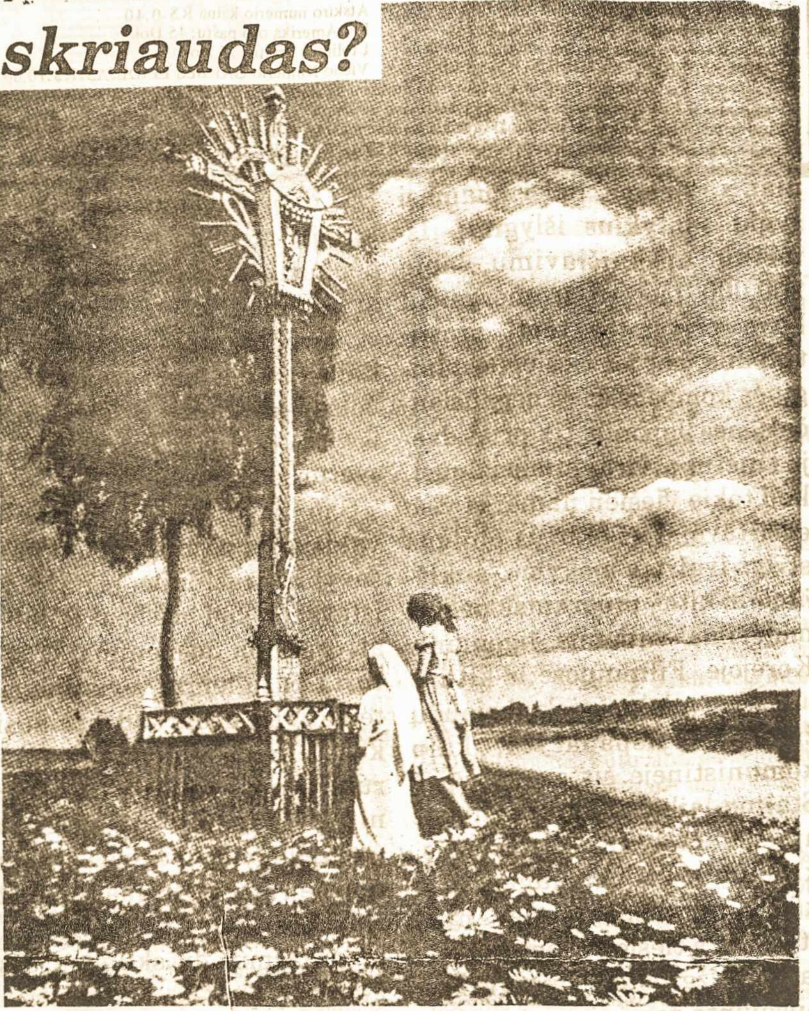
MALDA PRIE KRYŽIAUS

Dažnai priešų ieškoma ne tik už valstybės sienų, bet ir jų ribose. Antrojo pasaulinio karo metu net JAV neišvengė tos klaidos, internavusi japonų kilmės amerikiečius specialiose