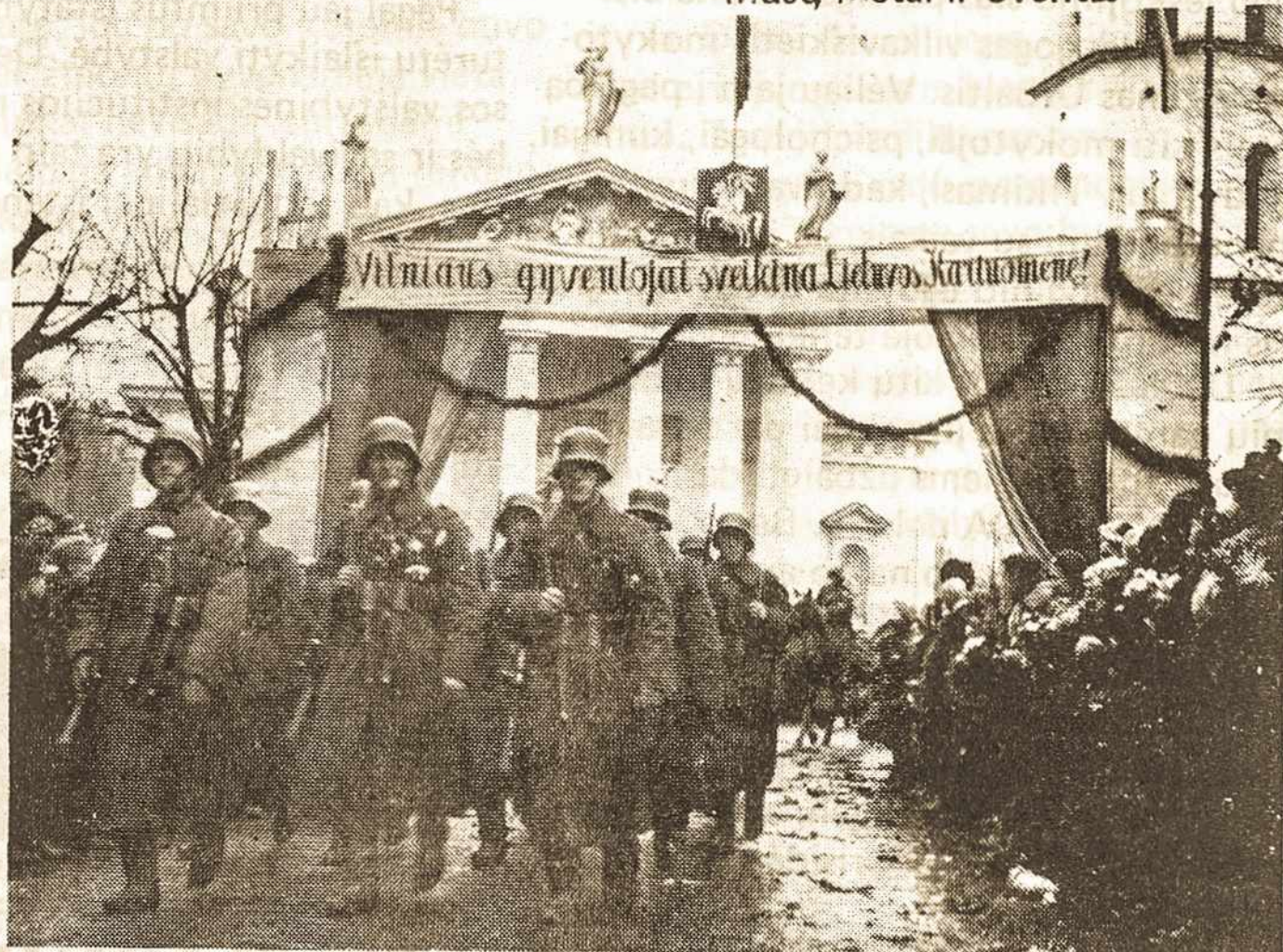
Lietuvos kariuomenė žygiuoja į Vilnių 1939 m. spalio 28 d.

Iš Angelės Vyšniauskaitės knygos "Mūsų Metai ir Šventės"