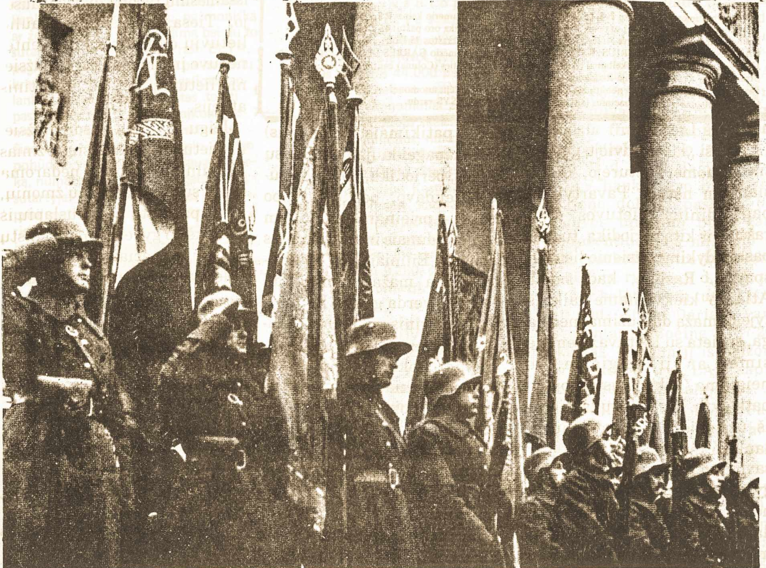
LAPKRIČIO 23 D. KARIUOMENĖS ŠVENTĖ: LIETUVOS KARIAI PRIE KATEDROS IŠLAISVINTAME VILNIUJE