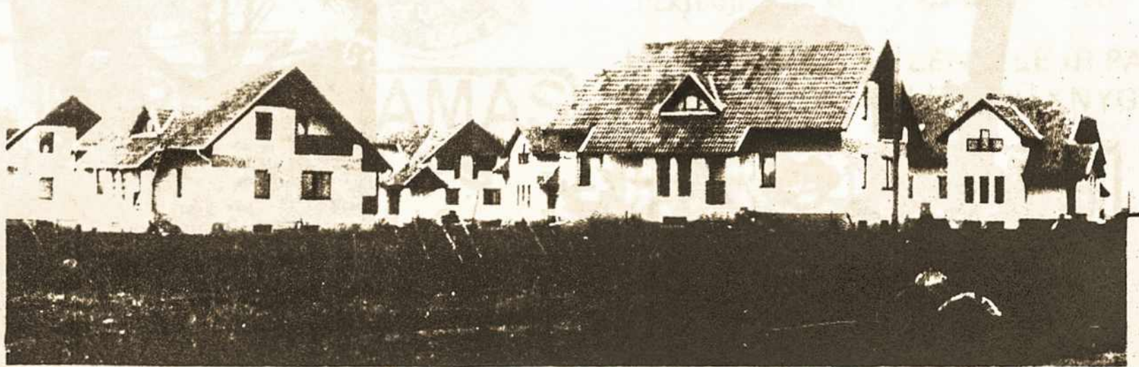
"Vaikų Tėviškės Namų" bendras vaizdas