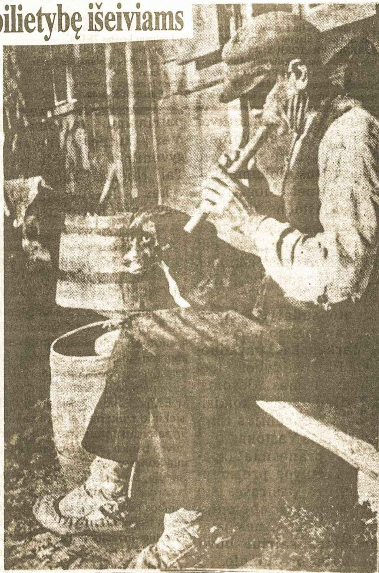
Lumzdelininkas(1935 m. Kupiškis)

Prezidentas Algirdas Brazauskas, atsiliepdamas į išeivijos teigimus, kad 1991 metų pilietybės įstatymas išbraukė iš Lietuvos gyvenimo užsienio lietuvius, ir į Pasaulio lietuvių bendruomenės pastangas įstatymą pakeisti, šių metų vasario 1 dieną sudarė komisiją "Pilietybės įstatymo pataisų projektui parengti". Į komisijos darbą įsijungė 11 išeivijos ir 6 Lietuvos atstovai, kurie posėdžiavo dviem etapais – gegužės 29-birželio 2 bei rugsėjo 4-8 dienomis. 1991 metų pilietybės įstatymas buvo nagrinėjamas ir redaguojamas, kad atitiktų ir išeivių lūkesčius ir tautos reikalavimus. Buvo