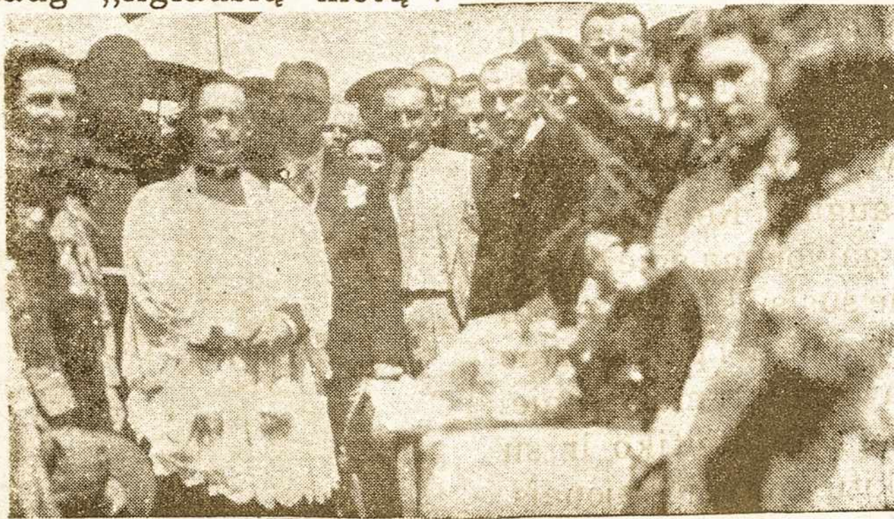
Bažnyčios kartinio akmenspašventinimas 1935 metų kovo 24 d.

Kantonigros mieste buvo susibūrę apie 1.500 muzikų ir šokėjų, kurie tarpusavyje varžėsi penkių grupių konkursuose: mišrių, vaikų ir moterų chorų, liaudies muzikos bei liaudies šokių. Mūsų miesto muzikalieji dalyviai Lietuvai atstovavo dviejuose pogrupiuose – mišrių chorų ir moterų chorų.