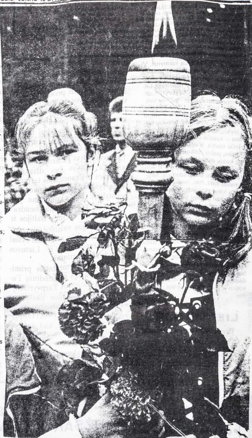
BIRŽELIO 14 DIENA: LIETUVIŲ TAUTOS GENOCIDO MINĖJIMAS Šios Tautos nelaimės pergyvenimo šviesa turi degti nuolat ir likti mūsų atmintyje

Rašome tų liūdnujų dienų istorijas, trėmimais ir iškeldinimais pavadiname, naudojame matonus šaltinius, diaromės naujų, kad tik išėitų pilnesnis vaizdas, kad nenukryptume nuo tiesos. Vieną kartą tas didelis ir reikšmingas darbas bus baigtas, užversime paskutinio tomo paskutinį puslapį. Šitiap įsiamžina dar vienas tautos gyvenimo laikotarpis, praturtės raštija, o dienos bėgs kaip bėga, klasėse sėdės