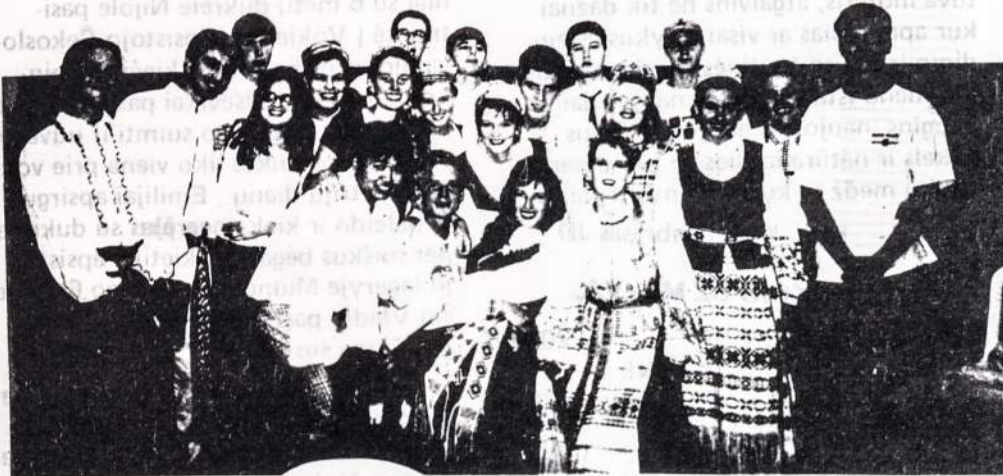
"NEMUNAS" rengiasi keliauti į XV tautinių šokių šventę Čikagoj