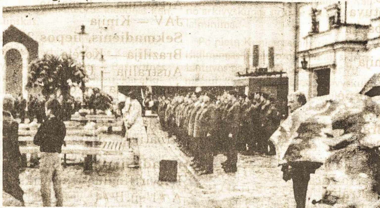
Mindaugo karūnavimo šventėje, vykusioje Klaipėdoje, teatro aikštėje, taip buvo išsirikiavę Lietuvos kariai