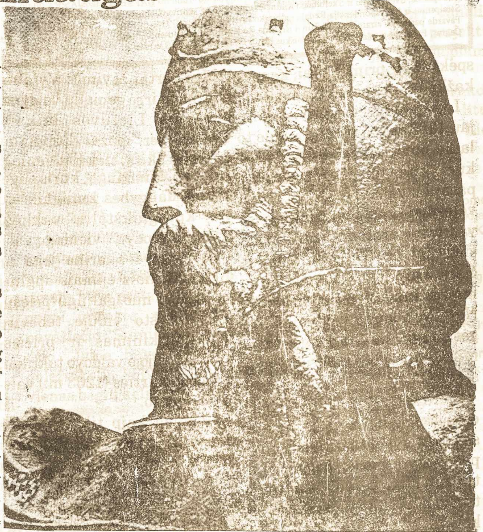
MINDAUGAS Lietuvos valstybės sukūrėjas ir jos pirmasis valdovas

Prieš 1918 m. nepriklausomybės paskelbimą didieji tautos žadintojai bei jų leidžiama lietuviška spauda stengėsi — ir labai efektingai — nukreipti lietuvių dėmesį į Lietuvos senovės istoriją, iškiepyti tautai, iš kokių šaknų ji kilusi, išmokyti didžiulis ta savo kilme, kurios praeityje, lyg švyturiai audringą naktį, mirgėjo didžiųjų valstybininkų-valdovų: Mindaugo, Gedimino, Kęstučio, Vytauto ir kitų vardai. Nepaisant (ypač lenkų) tvirtinimų, kad lietuvis valstietis buvo ir visuomet pasmerktas būti tik taru-baudžiauninku, kad jo papročiai, tradicijos, gyvenimo būdas, o labiausiai kalba, netinka „padoriai draugijai“, mūsų liaudis ir nemažai šviesuolių netruko atrasti savo tau-