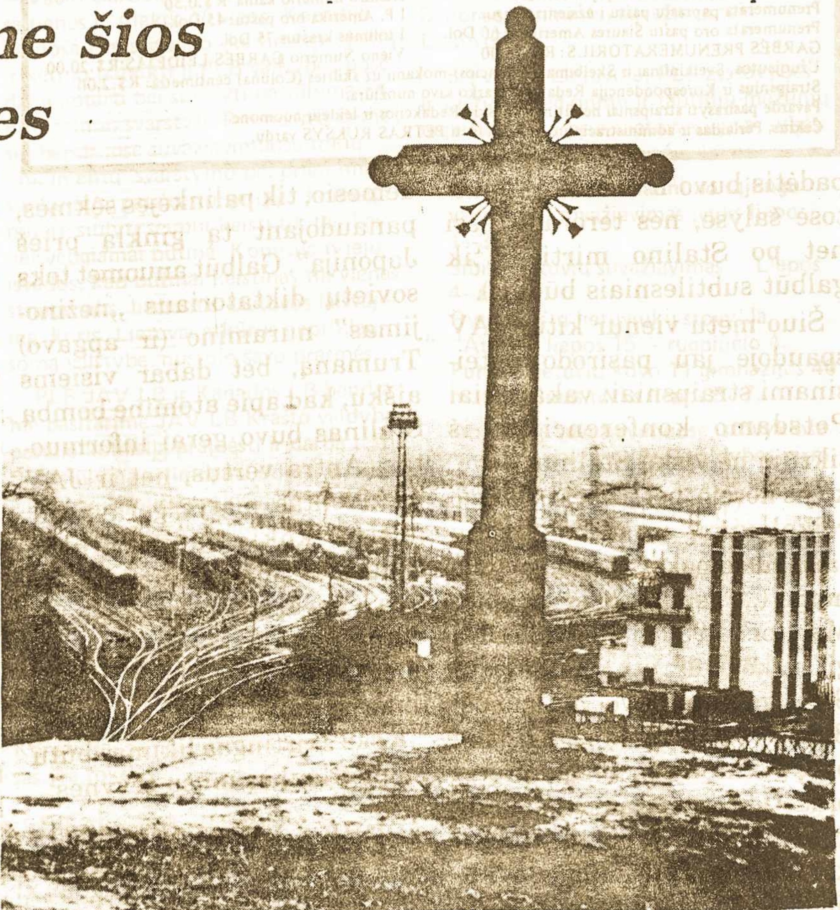
Sis vaizdas primena 1941 metų birželio sibirinius tremimus. Tai Kauno geležinio stoties priekyje buvo masiškai tremiami Lietuvos gyventojai į Sibirą.

Potsdamo konferencijos niekas neturi užmiršti, nes joje pasaulis buvo padalintas į du pagrindinius frontus: Rytus ir Vakarus. Vakariečiams atstovavo JAV prezidentas Harry Truman ir Didžiosios Britanijos premjeras Clement Attlee (Winston Churchill netikėtai buvo Anglijos gyventojų balsais