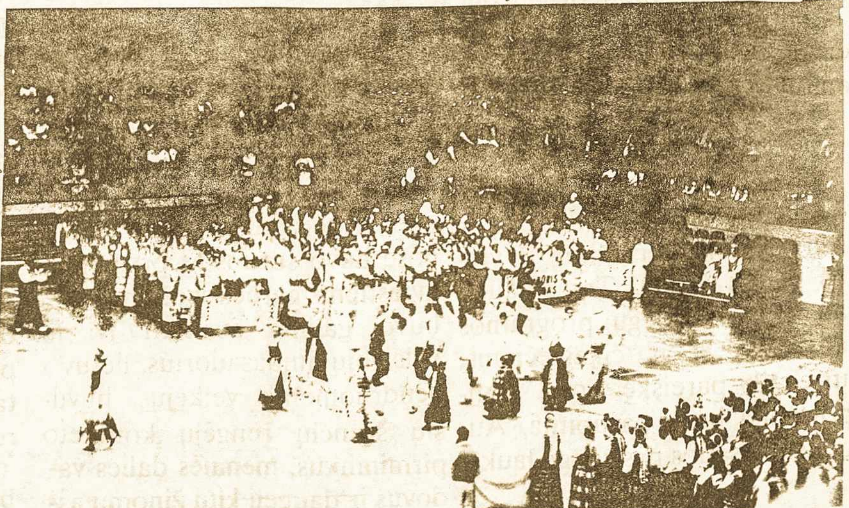
S. Paulo šokių ansamblis "NEMUNAS" dalyvauja tautinių šokių šventėje