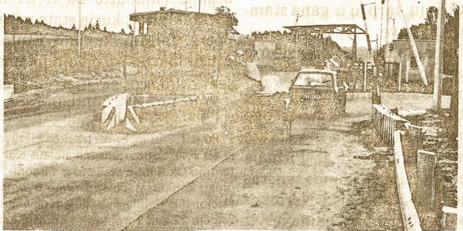
Medininkai. Sienos perėjimo punktas. 1992 m.