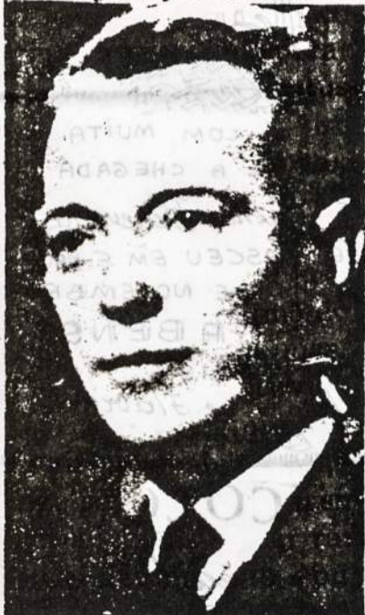
ANTANAS ŠABANIAUSKAS garsiausias Lietuvos pramoginės muzikos artistas naujai įgrotoj jo gražiausių interpretacijų juostelėj. "MŪSŲ LIETUVA".