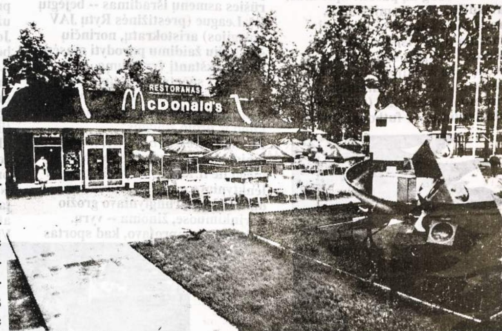
rmasis McDonald's restoranas, atidarytas Vilniuje. Šiuo metu jau veikia dvi McDonald's kandinės.