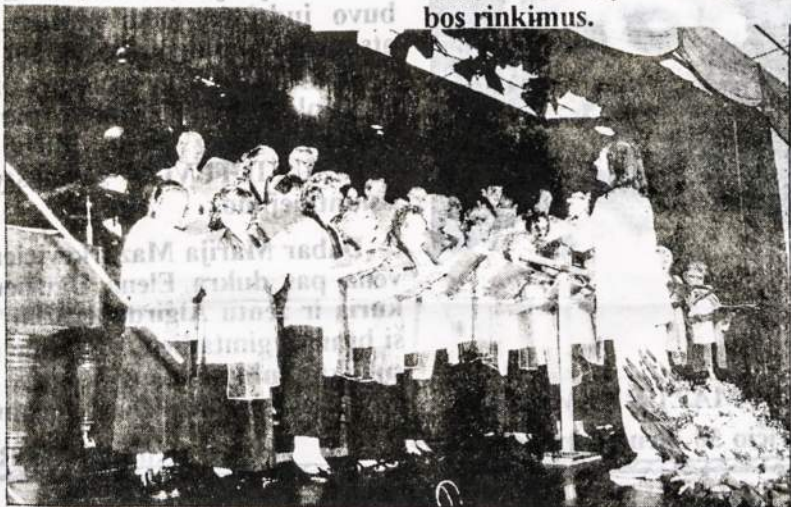
Apresentação reuniu a colônia lituana na Vila Zelina

Lietuvių Skautų Tuntas "Palanga" sveikina visus vadovus, padejėjus ir choristus kurie viską organizavo ir sutvarkė. Kad Dievas duotu dar 60 metų mūsų chorui ir visada garbindami Dievą ir mūsų gražią Lietuvą.