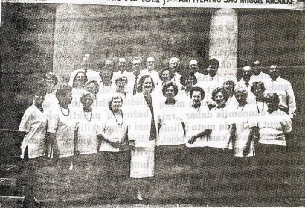
ŠV. JUOZAPO BENDRUOMENĖS CHORAS pasirošęs 60-ties metų jubiliejiniam koncertui

Lietuvių tauta visais amžiais pasižymėjo tvirtu tikėjimu — senų senovėje lietuvių likimas buvo „galingųjų dievų rankose“; krikščionybei pakeitus pa-gonybę — lietuvis visa širdimi atsigręžė į Dievo Apvaizdos globą. Tikėjimas mūsų tautai buvo svarbi gyvenimo tikrovė — stiprybė ir paguoda, bet ne fana-tiškas, kito tikėjimo žmonių ne-toleruojantis, nusiteikimas. Tai nereiškia, kad lietuvis ne-mokėjo savo religinių įsitiki-nimų ginti, nepabūgdamas nei galingų pavergėjų, nei jų smur-to. Pernelyg pasyvus ir ramus lietuvių žemdirbio būdas suliepsnodavo užsispyrėlišku ryžtu, jei okupantas pasikėsin-davo prieš jo didįjį turtą — tikė-jimą.