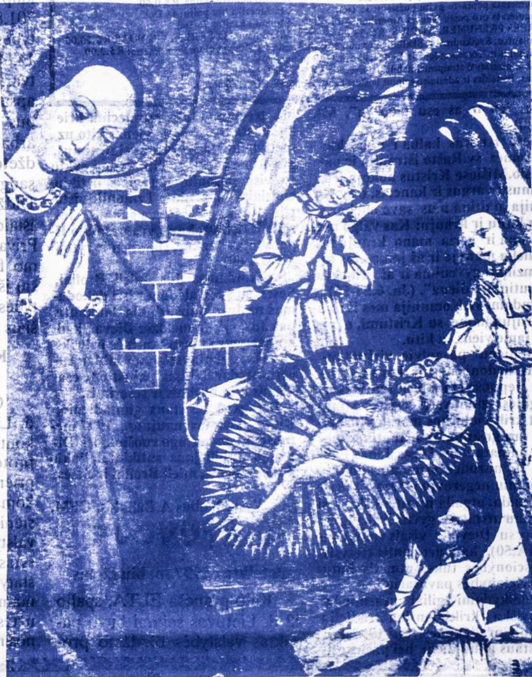
KRISTAUS GIMIMAS: XVI amžiaus holandų piešinys.

Kaip gimdami iš lietuvių tėvų gavome žmonišką gyvybę ir tapome lietuvių tautos nariais, taip priimdami krikšto sakramentą gavome dievišką Kristaus gyvybę, tapome Jo krikščioniškos šeimos nariais, Kristaus ir viens kito broliais ir seserimis. Mes esame taip savi ir artimi Kristui, kad tik per meilę artimui, mes išreiškiame meilę Jam. "Iš tiesų sakau jums, kiek kartu