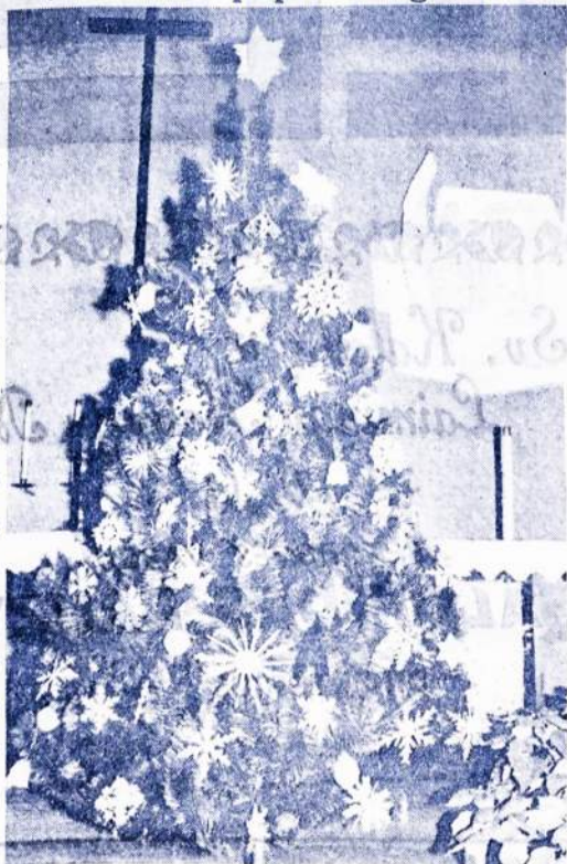
Kalėdu eglutė- Tėvų jezuitu koplyčioje - Cikagoj.

Viliojanti Lietuvos ūkio sfera užsienio investuotojams turėtų būti saldumynų, cukraus ir grūdų perdirbimo įmonės. Antai buvusi Kauno konditerijos gamykla, dabar „Kraft Jacobs Su hart Lietuva“ per metus gavo 40 mln. litų pelno. Vilniaus „Pergalė“ – 8 mln., Šiaulių „Naujoji rūta“ – per 8 mln. pelno. Tačiau patraukliausios pirkėjams turėtų atrodyti gėrimų pramonės įmonės. Pvz., pernai Kauno „Stumbras“ gavo 99 mln. litų pelno, Alytaus „Alita“ – 50 mln., „Anykščių vynas“ – 18 mln. ir t.t. Milijonais pelnus slaičiuoja lengvosios pramonės įmonės. Nepaprastai gerai dir-