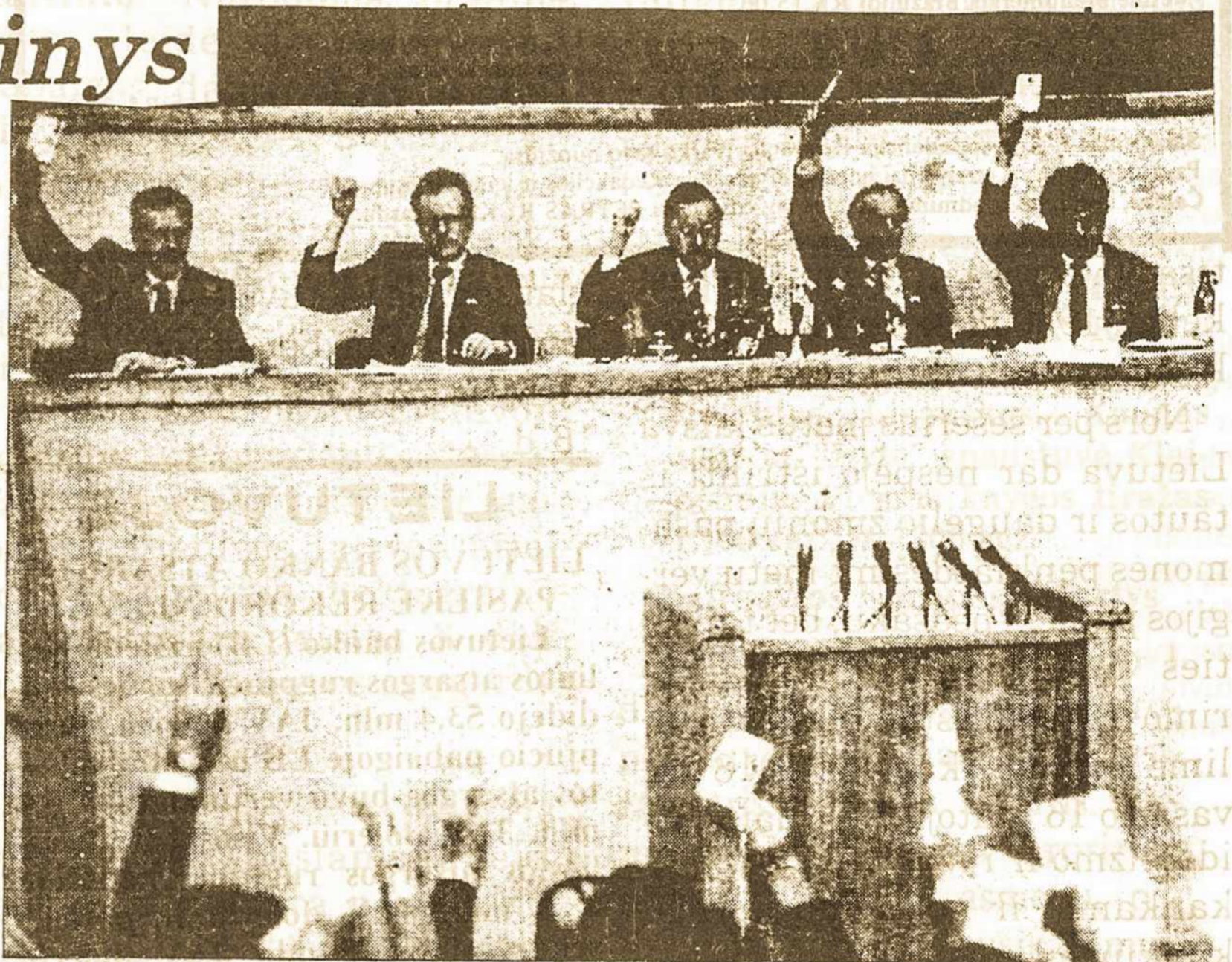
Auksciausioji taryba 1991 metu kovo 11 diena balsuoja uz Lietuvos nepriklausomybes atstatyma. Sis nutarimas tapo Vasario 16-tosios atgaivinimu bei tesiniu. Is leidinio "Lietuva 1994.01.13"

Praėjus visoms toms šventėms, džiugu buvo skaityti jų aprašymus ir stebėtis mūsų žmonių išradingumu, sudarant minėjimų programą. Sunku būtų suskaičiuoti visus, įsijungusius į Vasario 16-tosios iškilmų ruošą, — o dar sunkiau — iškilmėse dalyvavusią visuomenę. Tai, be abejo, buvo didingas meilės Lietuvai manifestas, turėjęs įrodyti, kad užsienio lietuvija ir gyva, ir stipri, ir pasiruošusi remti tėvynę, nors