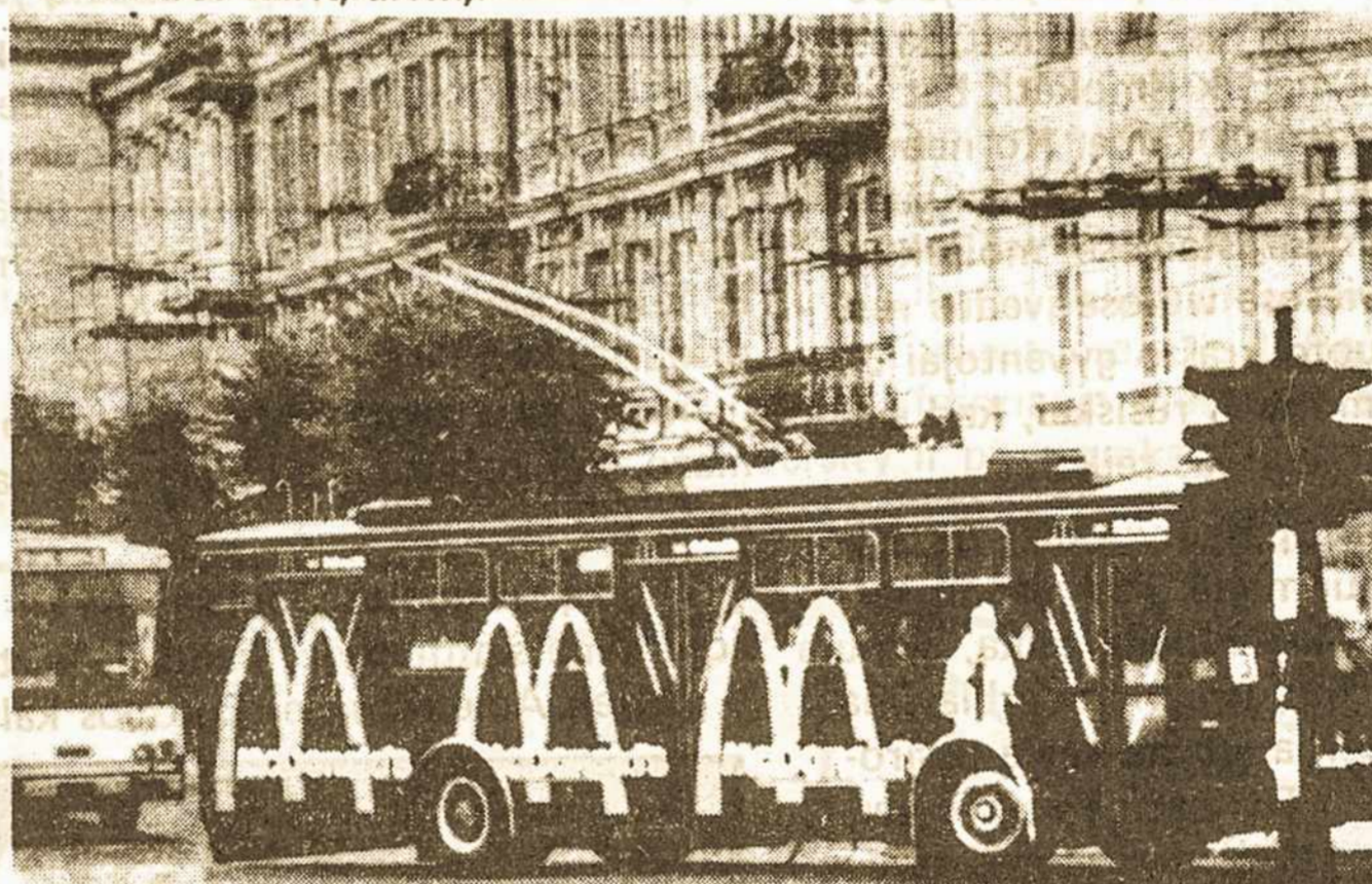
McDonald's restoranų reklamos matomos ant troleibusų Vilniuje, kur jie darosi populiarūs

Švedijos ūkininkas ketina samdyti 15 žmonių. Šilutės ra- jone 1,000 ha ketina išsinuomoti ir Jonavos trąšų kombinatas „Achema“. Pasak Šilutės rajono žemėtvarkos tarnybos viršini- ko, šiemet iš 28,000 ha nenaudo- jamos dirbamos žemės rajone liks tik 6-8 tūkstančiai hektarų.