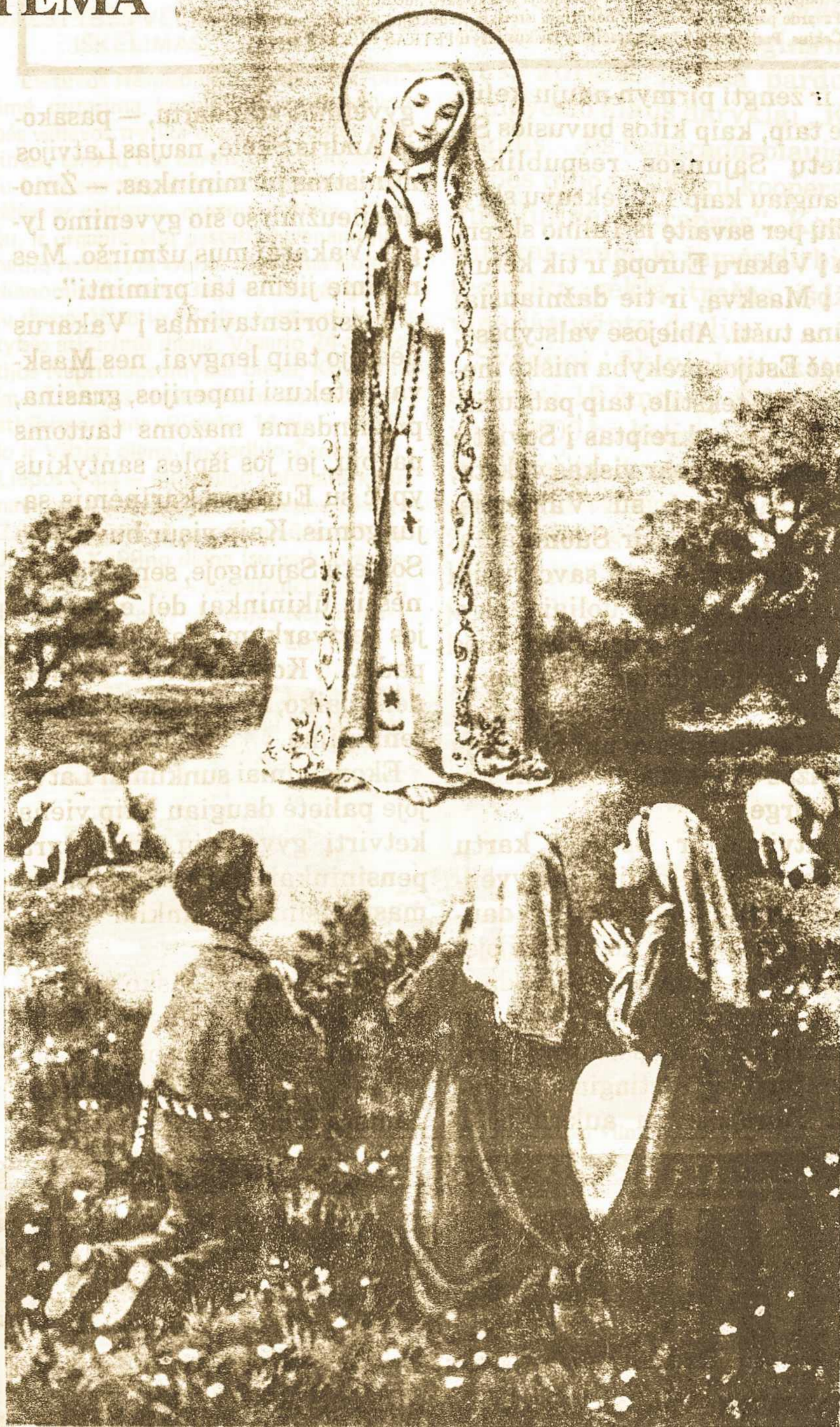
FATIMA - PORTUGALIJA: čia prieš 80 metų, gegužės 13 dieną, apsi- reiškė Dievo Motina Marija pranešdama, kad komunizmas bus Dievo rykštė pasauliui, bet kad per Jos užtarimą komunizmas bus nugalėtas

Baltijos valstybės atgavo nepriklausomybę iš Rusijos imperijos po 1917 m. bolševikų revoliucijos ir ja džiaugėsi iki 1940 m., kai Sovietų Sąjunga, susitarusi su nacių Vokietija, jas okupavo. Latviai ir estai tą pusę šimtmečio laikė karčia prievarta, nutraukusia ryšius su Europa. Kartu su jų kaimyne Lietuva tos valstybės siekė nepriklausomybės šio dešimtmečio pradžioje, kai Sovietų Sąjunga ėmė irti. Šiandien Latvija ir Estija nori užmiršti praei-