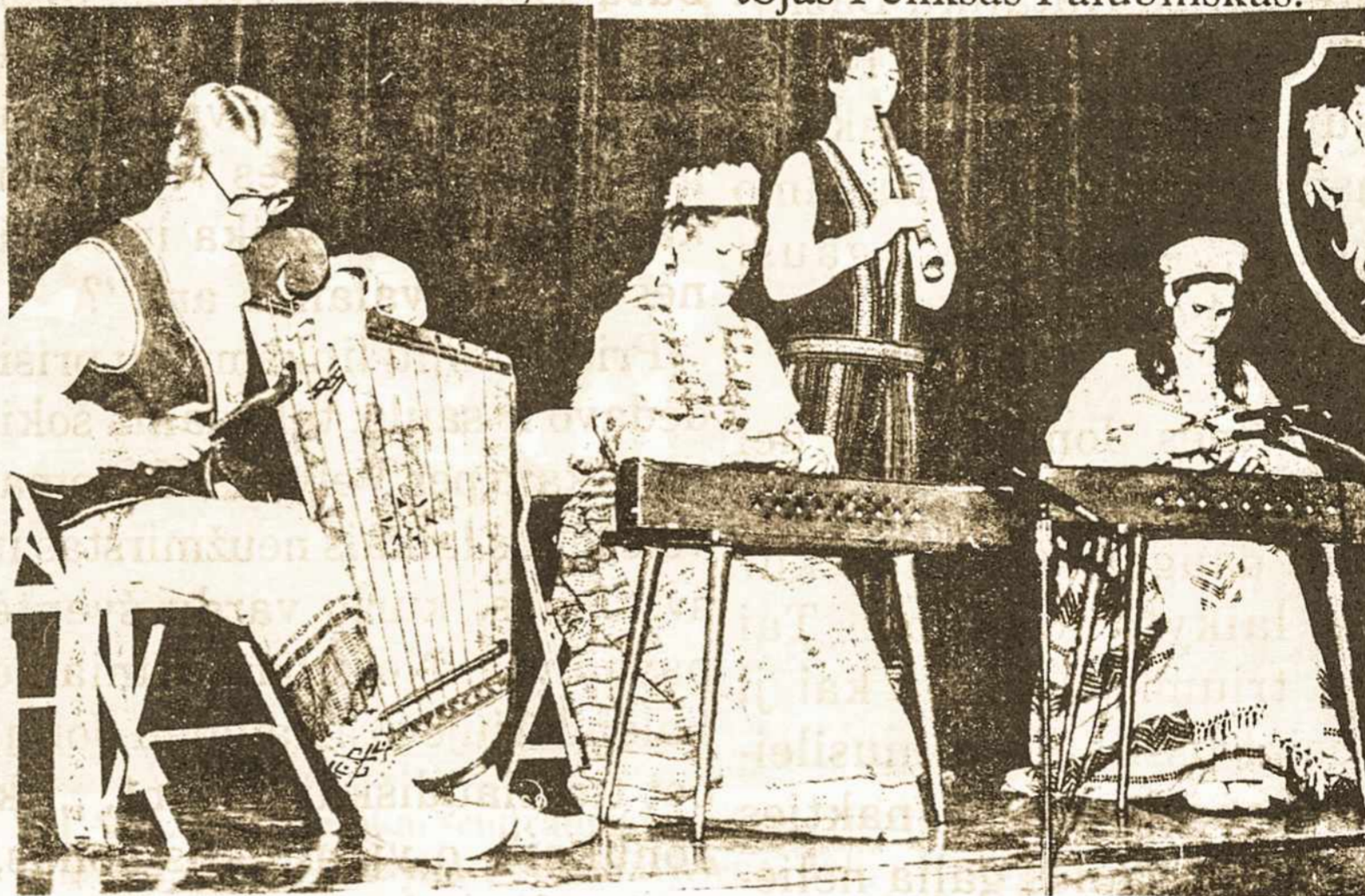
CLEVELAND: Birzelio tremimu minejimas sv. Jurgio parapijos saleje. Meninė programa atlieka Ciurlionio ansamblio kainklininkai-kes