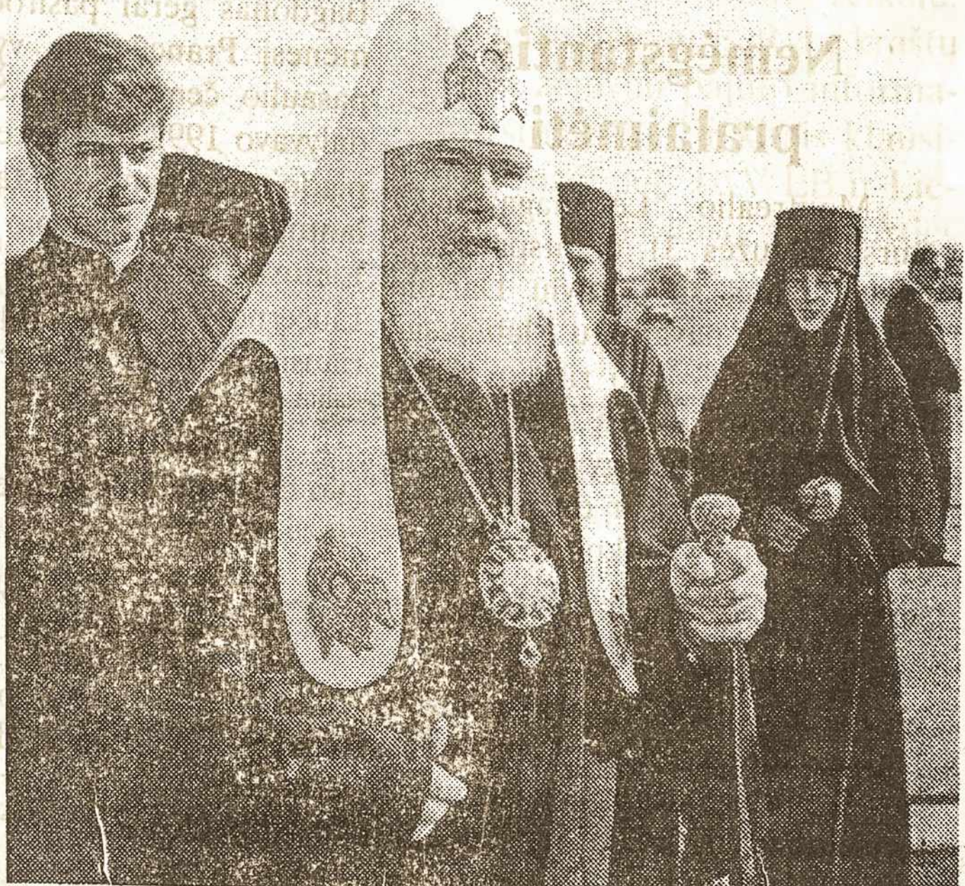
VILNIUS: Rusijos stačiatikių bažnyčios viršininkas patriarchas ALEKSIJUS II lankėsi Lietuvoje liepos mėnesio pradžioje

Italijos prezidentas Oscar Luigi Scalfaro lankėsi Lietuvoje gegužės 20-21 d.d. Jis susitiko su Lietuvos prezidentu Algirdu Brazausku, seimo pirmininku Vytautu Landsbergiu, ministru pirmininku Gediminu Vagnorium ir kitais pareigūnais. Buvo aptarti dvišaliai santykiai bei Lietuvos noras tapti Europos sąjungos ir ŠAS nare, praneša ELTA. Taip pat pasirašyta tarpvyriausybinių sutartis dėl asmenų gražinimo, kuri įsigalios pradėjus veikti Lietuvos ir Italijos beviziam režimui. Italijos prezidentas teigė, kad "jo valstybė remia poziciją dėl visų valstybių lygių teisių užtikrinant savo politinį ir ekonominį saugumą".