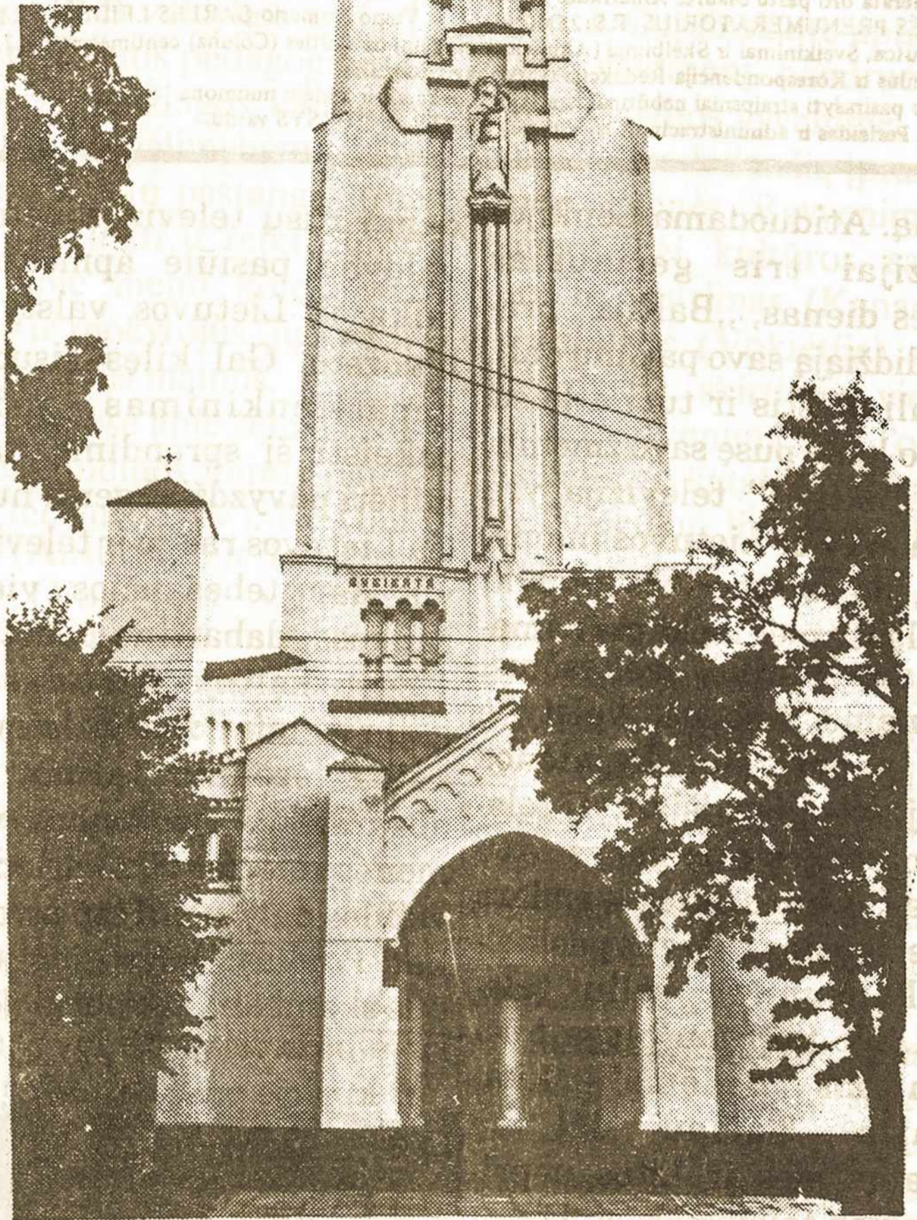
Marijos apsiareiškimo koplyčia Šiluvoje