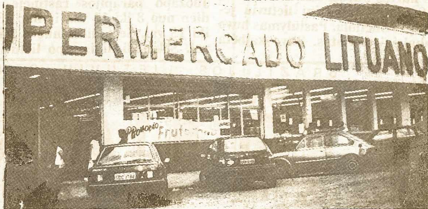
SUPERMERCADO LITUANO vaizdas iš das Heras gatvės pusės