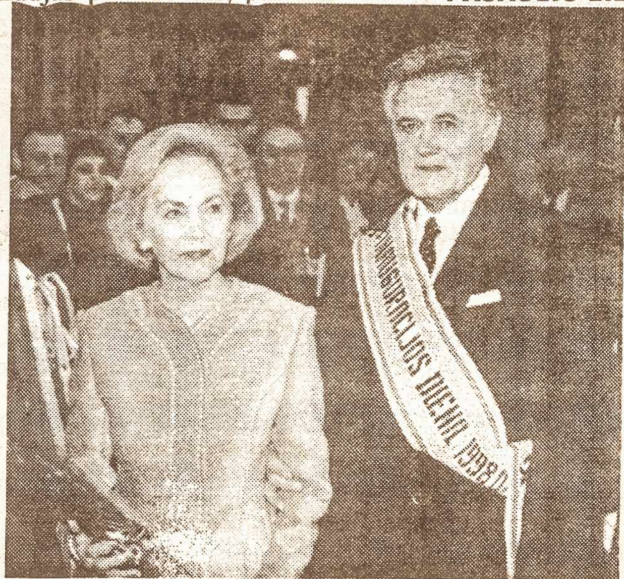
Juosta ką tik prisiekusiam Prezidentui

Katedros aikšteje kalbėdamas tautai - naujas prezidentas, pab-