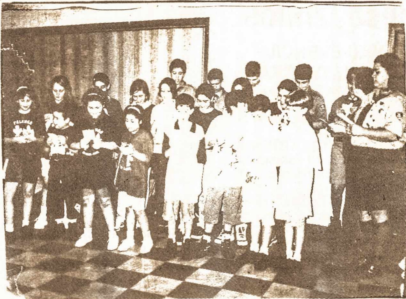
Šv. Kazimiero šventės didieji protagonistai – mūsų skautai gieda šv. Kazimiero šventės giesmę: "Neste dia de alegria..."

Suneštinė arbatėlė buvo Jaunimo Namuose. Programoj buvo numatyta rodyti lietuviškas filmas, bet jis paštu mus pasiekė tik tai sekančią dieną. Skautai sugiegojo šv. Kazimiero giesmę portugališkai, o po to vyko šeimyniškos vaišės.