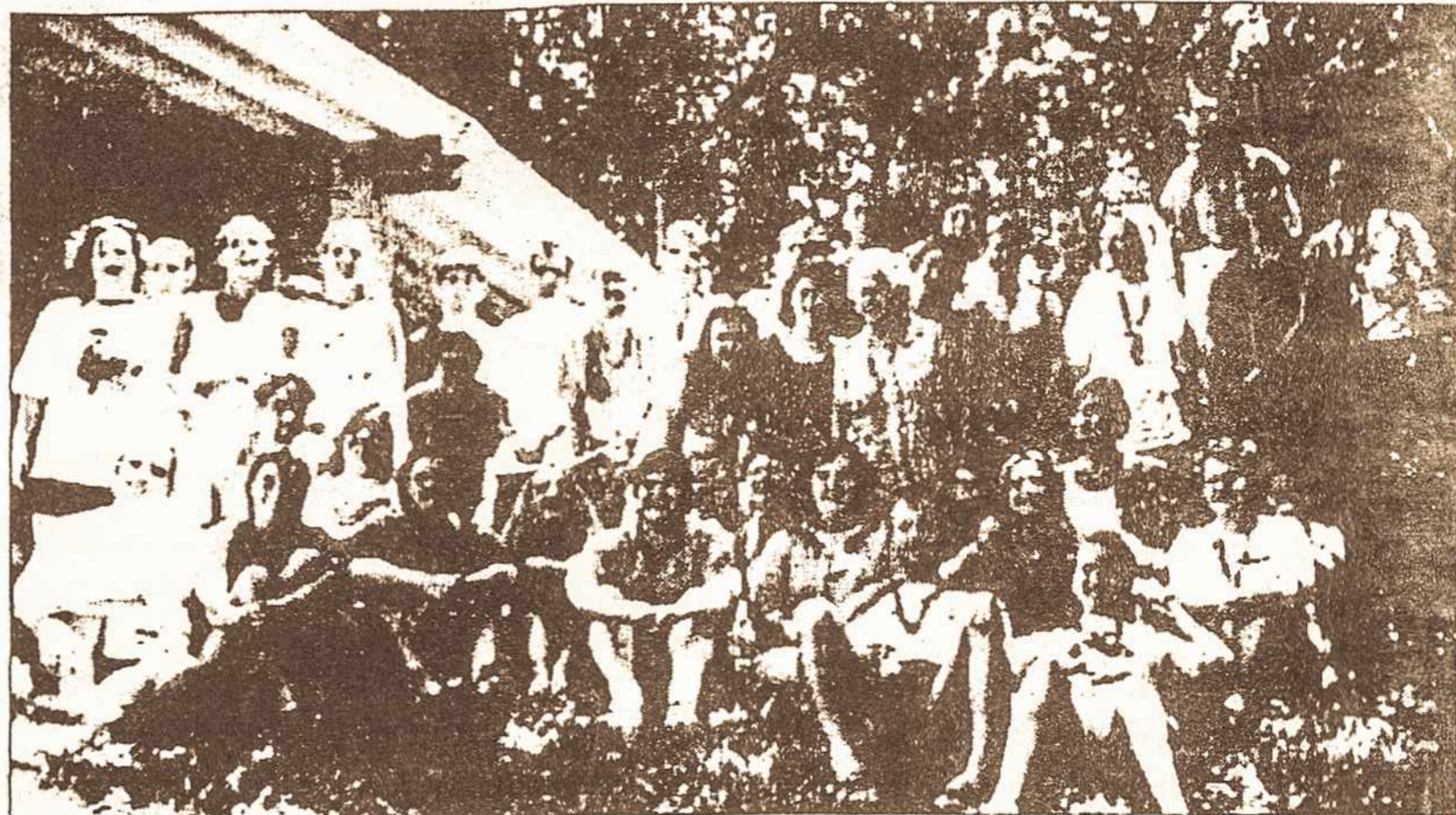
Pietų Amerikos lietuvių jaunimo suvažiavime Brazilijoje dalyviai