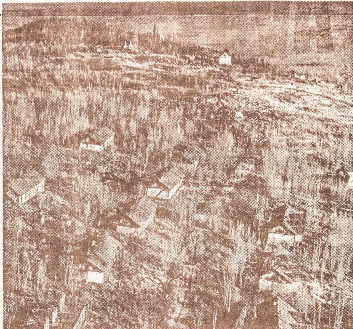
Krasnojarsko kraštas: Kureikoje tremtinių barakai

Niekuomet mūsų tautos gyvoji praeitis taip dažnai nekartojama, kaip birželio mėnesio viduryje. Kone kiekvieno vyresnio amžiaus lietuvio atmintyje išpausti neišdildomi birželio