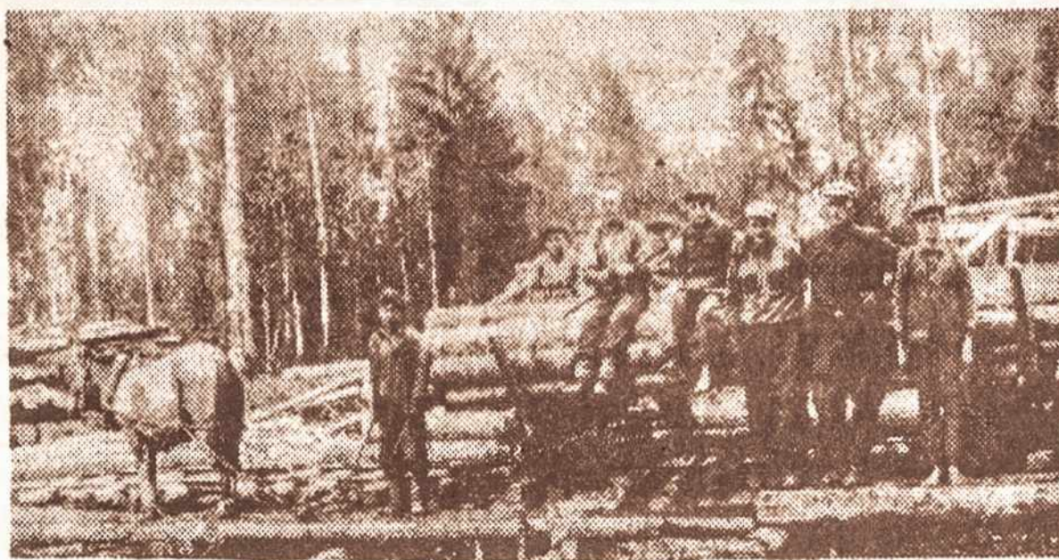
Tremtiniai kerta sibirinius miškus Tomsko srityje

Tačiau neatlyginta skriauda, nors barstoma užmaršties milteliais, dar netampa balta, kaip sniegas. Dar per daug yra gyvųjų, savo akimis mačiusių, savo ausimis girdėjusių ir graužiomis ašaromis vilgiusių gyvulinių vagonų ešalonuose suvarytus artimuosius, pamerktus baisia kelionei į tremtį, galbūt ir mirčiai. Daugelis tik per Dievo malonę susidėsčiusias aplinkybes išvengė panašaus likimo, gal ir dėl to, kad buvo paskirti antrajam išvežimo etapui (pritrūko vagonų visiems tremiamiesiems), o paskui prasidėjo Sovietų Sąjungos-Vokietijos karas ir atėjo bent laikinas išsigelbėjimas. Taip atsitiko ir mano tėvams, nors mūsų šeima ne vieną naktį teko nakvoti miške, kol kažkur vakaruose birželio 22-rosios naktį, išgirdome duslų griaudimą. Tai nebuvo pirmasis vasarės perkūnas, o vokiečių lėktuvų numestų bombų sproginimai, bet mūsų mamai ir tėteliui dar tūkstančiams lietuvių, išvengusių tremtinių likimo –