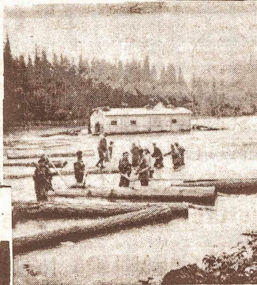
Krasnojarsko krašto tremtiniai nežmoniškose salygoose plugdo rastus

Lietuvoje šiuo metu užregistruotos 4,362 bendros ir užsienio kapitalo įmonės, kurių įstatinis kapitalas sudaro daugiau kaip 992 milijonus litų. Užsienio investicijos Lietuvoje šių metų pradžioje sudarė daugiau kaip 600 milijonų litų.