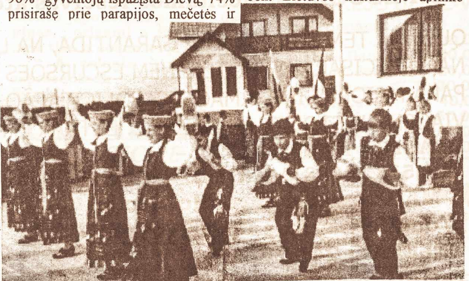
MARIJAMPOLĖ: "Vaiko tėviškės namų" atidarymo iškilmėse "Malūnėlio Ansamblio" vaikai atlieka meninę programą

5) Lietuvoje nuo Atgimimo rašoma kartais kalbama apie tautinę mokyklą: Lietuvoje kitaip negu likti lietuviu; bent Lietuvos kulturinėje aplinko