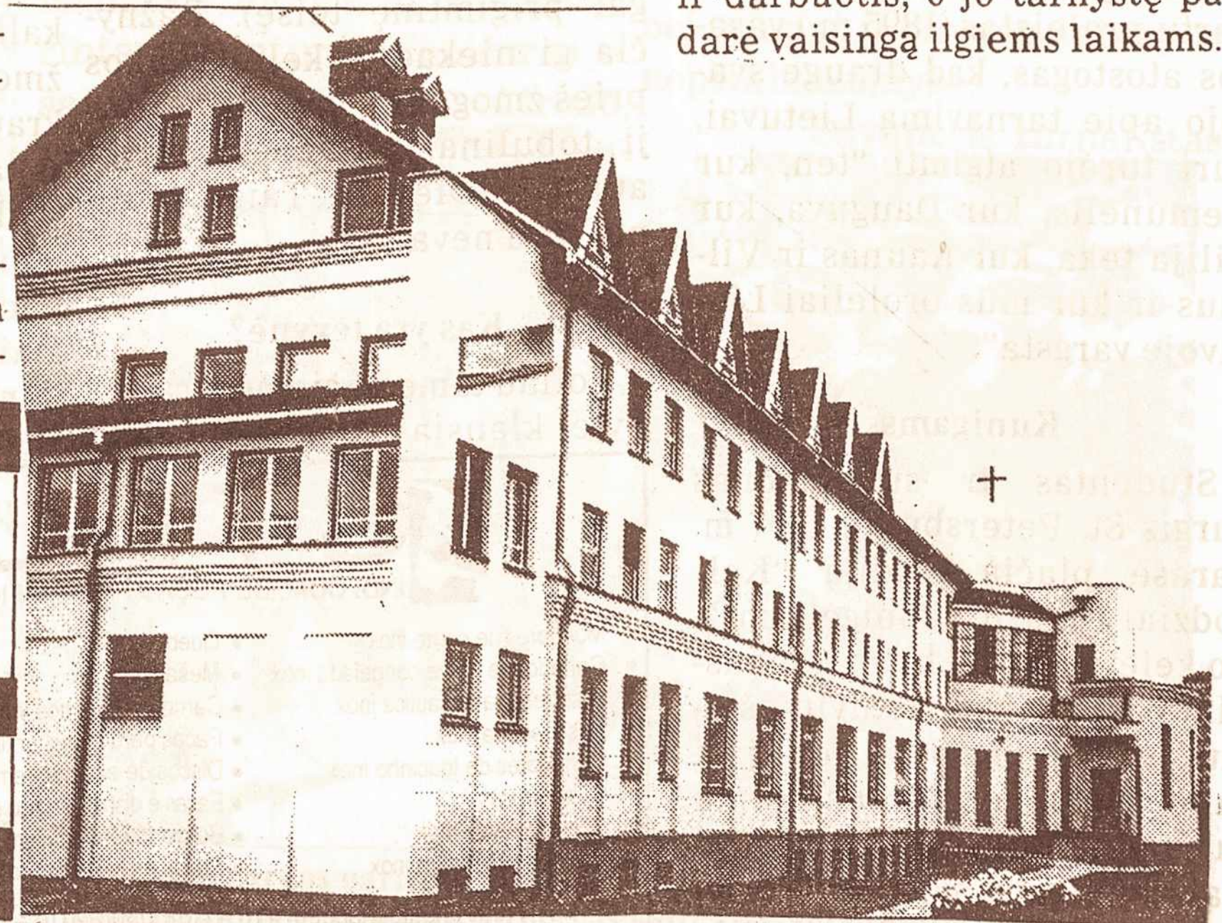
Palaiminto Jurgio Matulaičio namai Kaune

Palaimintojo Jurgio gyvenimas yra ryškus pavyzdys, kaip šventas žmogus gali savyje ir savo veikloje suvienyti didelę krikščionišką Dievo ir artimo meilę, pasiaukojamą darbą įvairių tautybių žmonių orumo ir išganymo vardan su gražiu tarnavimu tėvynei ir savo tautai. Dievo malonė įkvėpė mūsų palaimintąjį taip gyventi ir dirbti, o jo tarnystę padarė vaisingą ilgiems laikams.