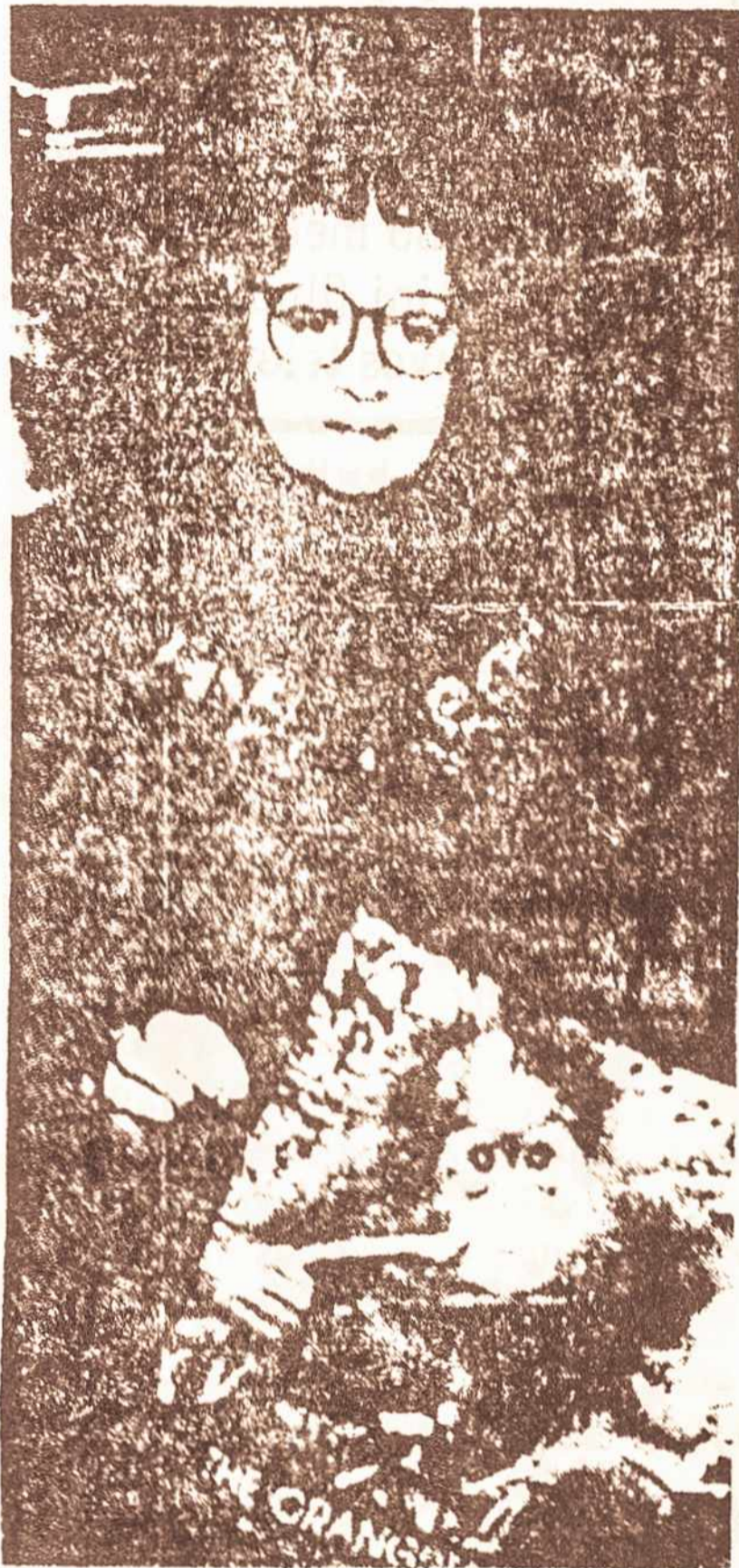
Dr. Birutė Galdikaitė

Los Angeles. Tarptautinio orangutanų fondo prezidentei, Simon Fraser universiteto