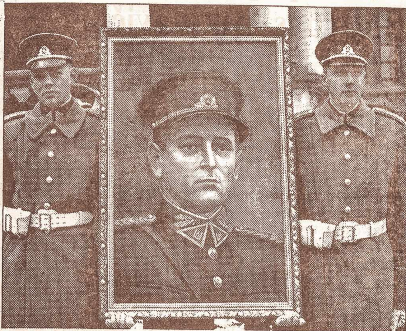
Kovo 7 d. aikštėje prie Krašto apsaugos ministerijos Vilniuje pagerbtas Lietuvos Laisvės kovų sąjūdžio gynybos pajėgų vado, dimisijos brigados gen. Adolfo Ramanausko-Vanago, kuris kovo 6 d. būtų sulaukęs 80 metų amžiaus, atminimas.

Įsibrovus vokiškiems daliniams į Sov. Sąjungą ir prieš metus okupuotus Baltijos kraštus, tūkstančiai latvių ir estų savanorių užsirašė kovai prieš komunizmą, tikėdami, kad vokiečiai jų tautoms suteiks savivaldą, kurią jie po