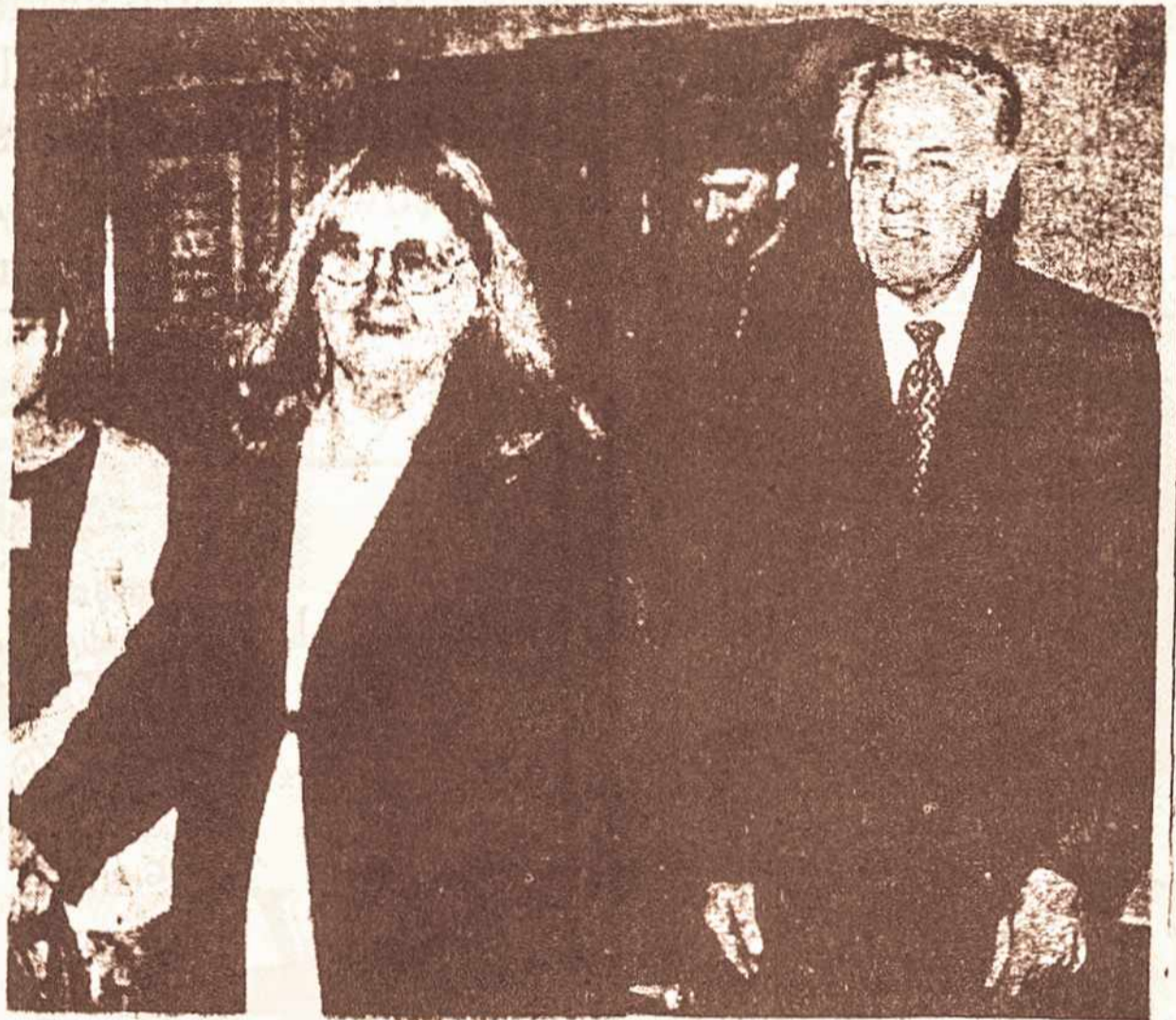
Birutė Galdikaitė Vilniuje su prez. Valdu Adamkum

Dr. Birutė Galdikaitė, pati eilę metų gyvendama Indonezijoje džiunglėse, paskelbė vertingu ekologinių darbų, jos