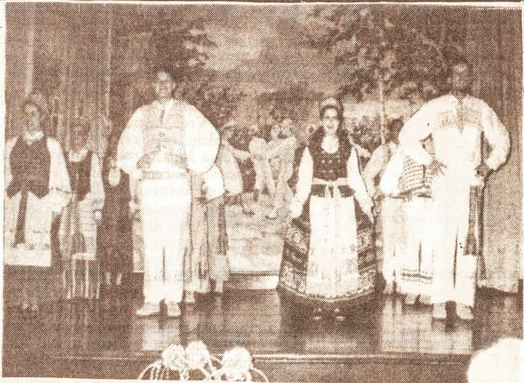
Tautinių šokių grupė "Rambynas" pasirodo metinėje Sąjungos šventėje