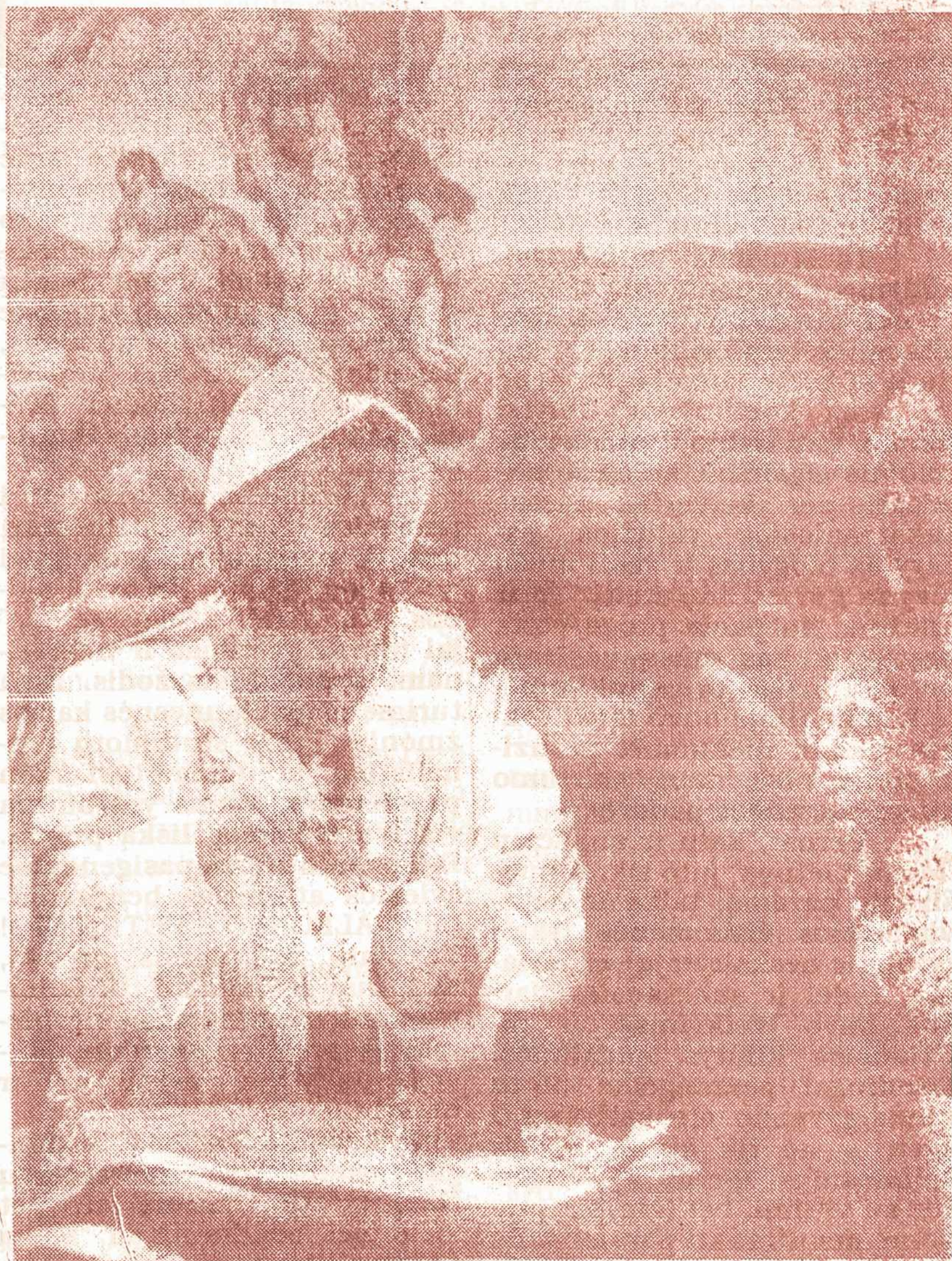
POPIEŽIUS JONAS PAULIUS II viltingai pradėjo Naujuosius Metus pakrikštydamas devyniolika kūdikių Sikstinos koplyčioje

Tad visų pirmą "Mūsų Lietuvos" redakcija nuoširdžiausiai sveikina visus savo skaitytojus, bendradarbius, rėmėjus, taikininkus, geradarius ir visą lietuvišką visuomenę su Naujaisiais Metais. Linkime visiems sveikatos, ištvermės, susiklausimo, vienybės ir gero šilto, šeimyniško jausmo, kuris visus jungtų darbuotis Lietuvos labui, bet kartu su lietuviybės išlaikymo, klestėjimo, gyvybiškumo už tėvynės ribų gerovei. Linkime atsikratyti menkavertiškumo liekanomis, didžiutis savo kilme, savo atliekamais darbais, savo kultūrinėmis vertybėmis - atsiņestomis iš tėvynės ir sukurtomis sveimuose kraštuose. Linkime gerbti vienas kitą, padėti vienas kitam ir palaikyti glaudų ryšį, jeigu ne asmeniškai, tai bent per lietuvišką spaudą (ypač "Mūsų Lietuvą"). Kol į mūsų namus teina bent vienas lietuviškas mikraštis, niekuomet nesijausim vieni, nes jis jungia visus lietuvius į tvirtą, artimą, nesuskaldomą vieneta.