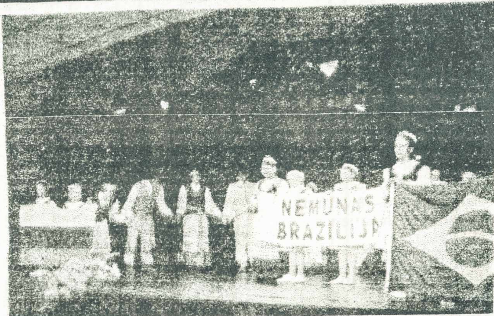
"NEMUNAS" prisistato publikai per Vasario 16-sios minėjimą