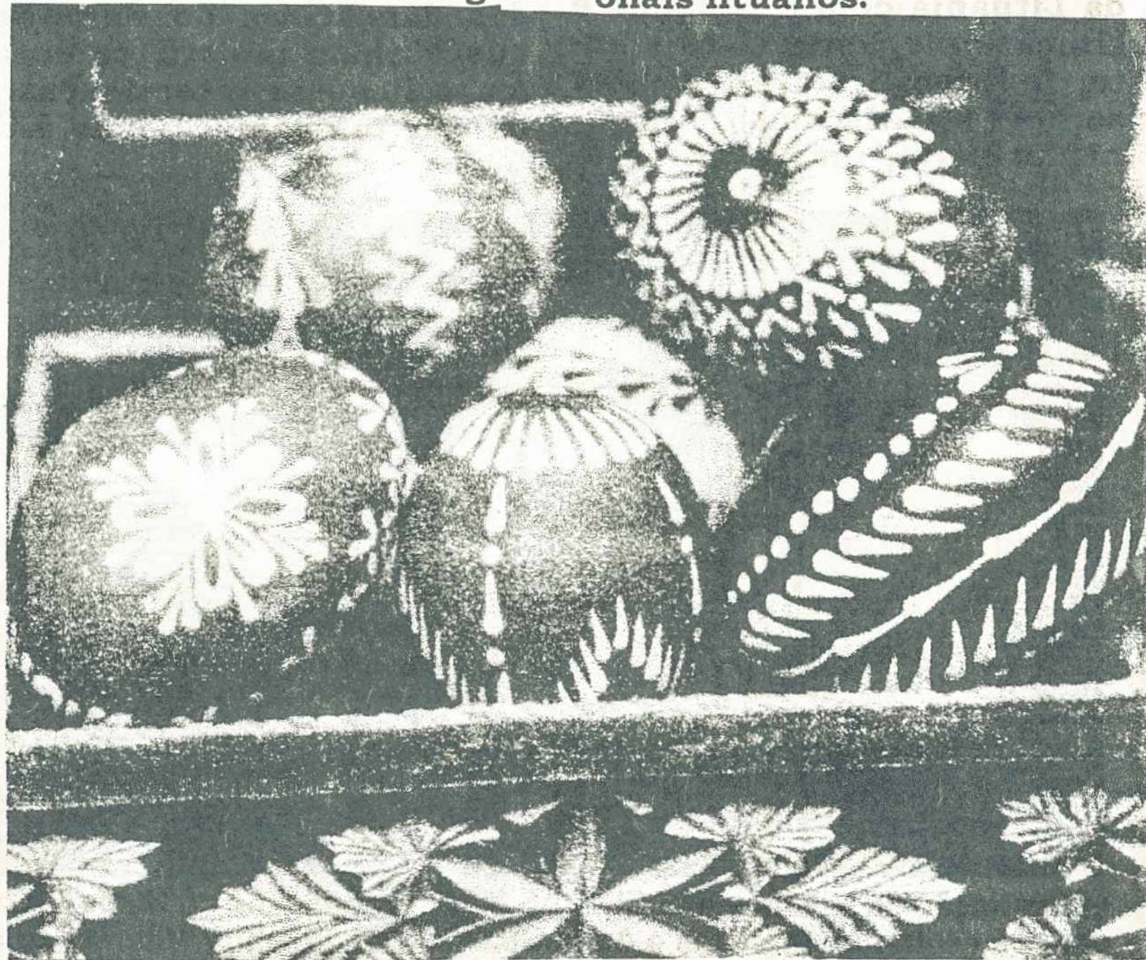
MARGUČIAI - ovos de Páscoa típicos lituano. Sem eles, não há Páscoa!