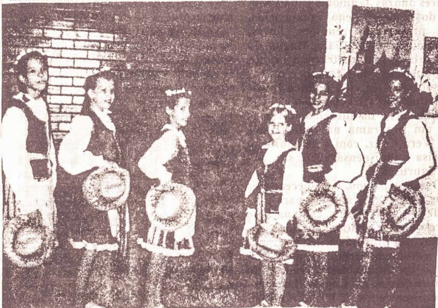
As meninas do "Nemunas" se apresentando no Rio (salão da paróquia polonesa) na comemoração da independência da Lituânia

A tessitura de cada ovo, produzindo efeitos de desenhos variados numa simbologia típica, mostra um dimensionamento bem variado. São formas de referências: "reketukai", "erskétukai", "zvaigzdykiai", "zvaigzdynas", "nageliai", "nuoliai", "sniegulés", "sluotelés", "line liai", "svimalangis", "karklaziedis", "vainikas", "ausriné" e outros. São nomes utilizados nas regiões da Lituânia e projetados em comunidades espalhadas pelo mundo. Suas formas traduzidas representam constelações estelares de espinhos ou unhas, lineares, flocos de neve ou orvalho com incidência do sol ou estrelas matutinas. São tão diversificadas as formas criadas para a beleza dos "margučiai". Não consulte a "Enciclopédia Lituana" ou tantos outros trabalhos acerca de "margučiai", como por exem-