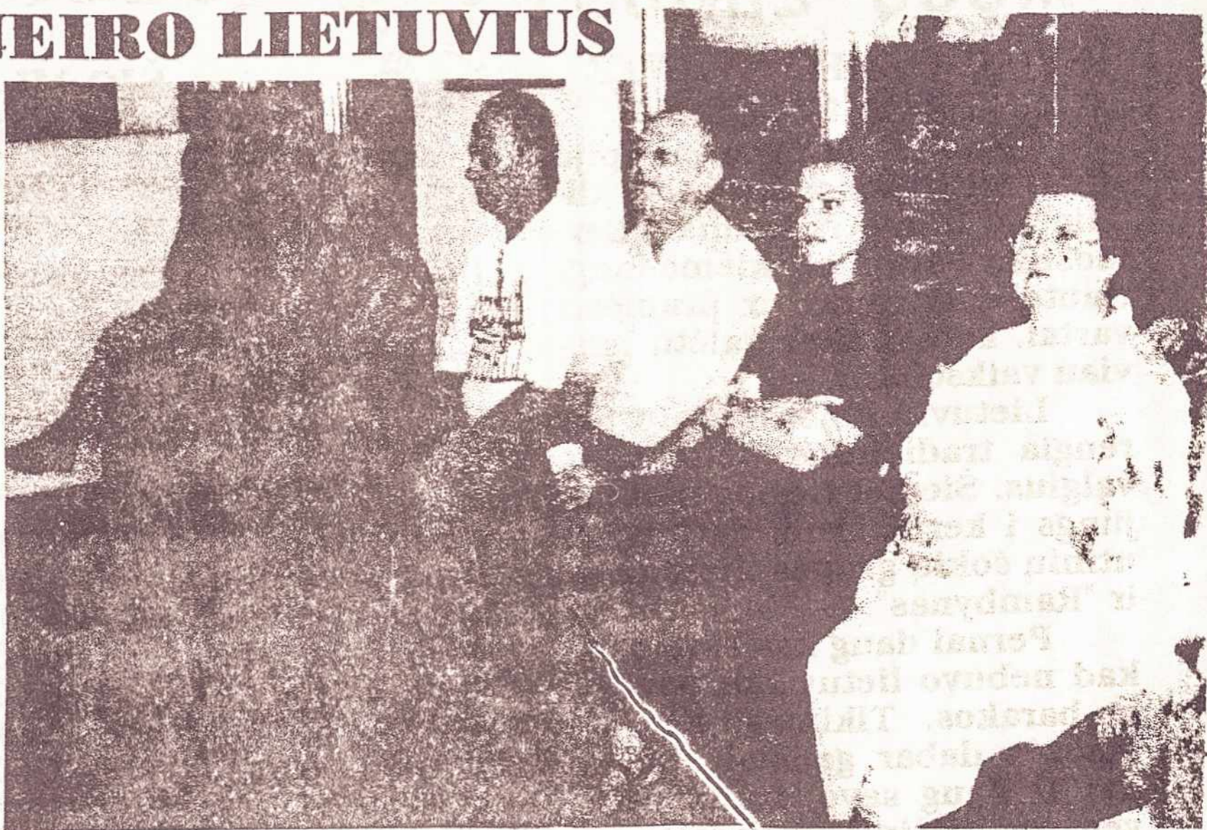
Kai kurie šventės dalyviai stebi "nemuniečių" atliekamus tautinius šokius

Mums renkantis, vyko lenkiškos Mišios, kurias laikė lenkų kunigas. Viskas buvo lenkiškai, tačiau tikinčiųjų gal buvo tik 10-15.