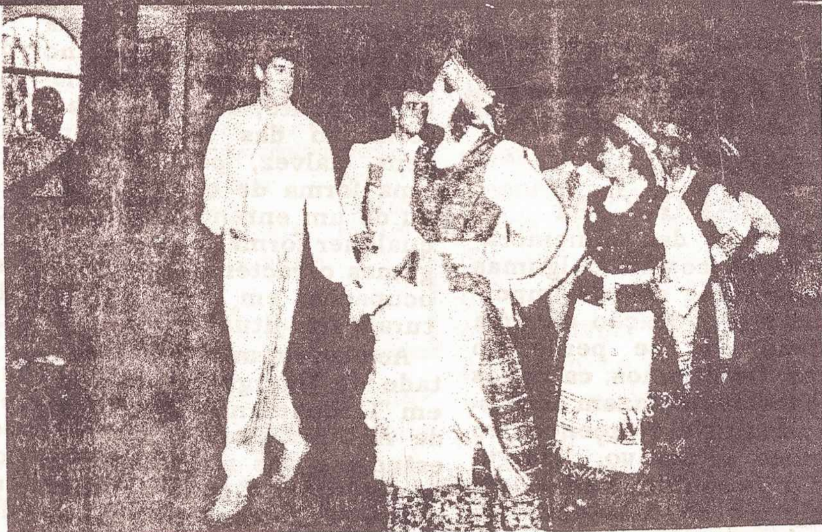
Integrantes do Grupo NEMUNAS na apresentação aos cariocas, pela festa de Independência da Lituânia