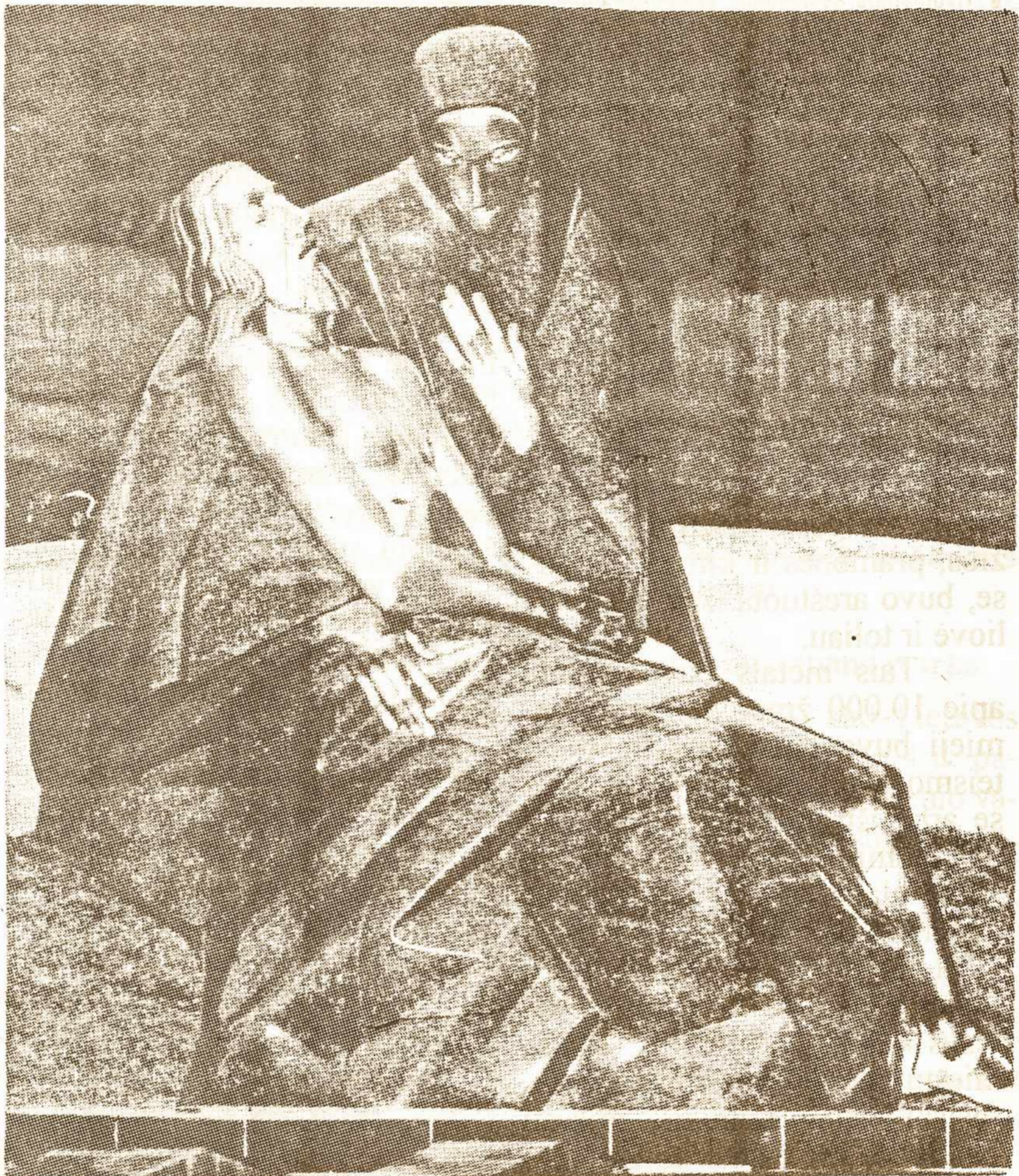
TAUTOS KANČIOS ŽENKLAS: Antakalnio kapinėse pastatytas paminklas žuvusiems už Lietuvos laisvę. Skulptorius Stanislovas Kuzma

Kai kalbame apie šventes, įsivaizduojame linksmumą, džiaugsmą, giedrią nuotaiką. Liūdesys ir skausmas mūsų galvose ne visiškai nesiderina su šventės sąvoka. Net Lietuvos Nepriklausomybės paskelbimo Šventę (vasario 16 d.) švenčiame iškilmingai, nors ta nepriklausomybė buvo prarasta vos po 22 metų nuo jos paskelbimo. Tačiau nuo 1940 m. birželio mėn. vidurio lietuvių tautos gyvą, galime sakyti, liūdesio ir venime atsirado liūdesio šventė, skausmo diena. Nepriklausomos Lietuvos gyvenimas pasibaigė 1940 m. birželio 15 d., kai Sovietų Sąjungos kariuomenė okupavo kraštą. Visa vaistybės santvarka vėl atsidūrė svetimųjų rankose. Bolševikai galvotrūkiškais skubėjo panaikinti laisvosios Lietuvos gyvenimo ženklus iš mokyklų buvo išmesti kryžiai, pašalintas tikybos dėstymas, uždrausta spausdinti kai kurias (ypač religinio turinio) knygas, leisti buvusius laikraščius, žurnalus. Lietuvos trispalvė bematant pakeista raudona komunistų vėliava, o vytiš - kūju ir pjautuvu. Kariuomenė, policija, savivaldybė, kiekviena valdiška įstaiga ir institucija buvo kontroliuojama, pagrindiniai valdininkai keičiami vietiniais komunistais arba rusais. Organizacijos, veikusios nepriklausomoje Lietuvoje, buvo uždraustos, jų veikimas sustabdytas. Mokyklose ir įstaigose vėl pasigirdo rusų kalba, kaip senaisiais carų laikais, tik šį kartą kartu dar buvo vartojama ir lietuvių kalba.