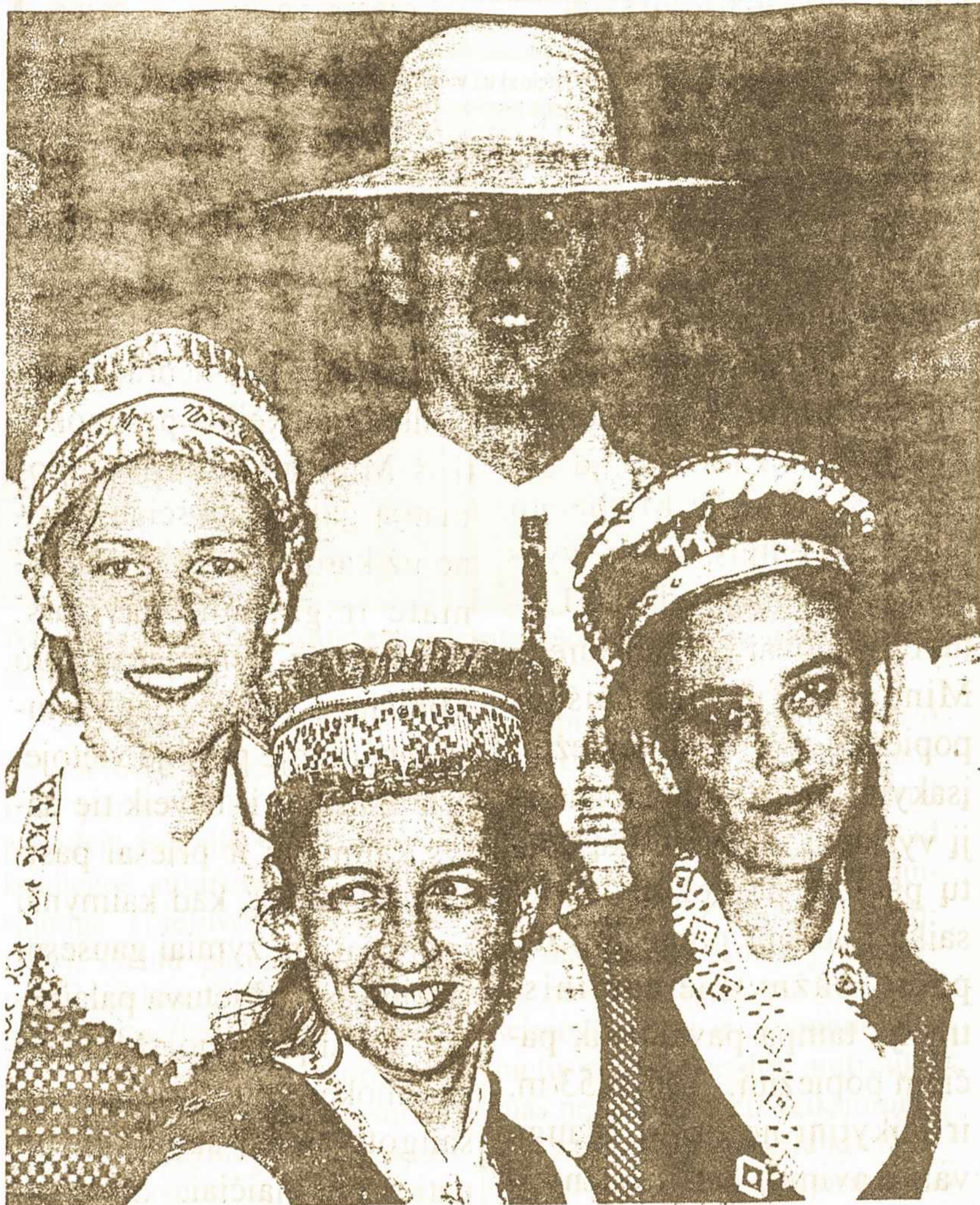
NEMUNAS BRASILIJA: grupo de danças típicas que já se apresentou em Chicago e em Vilna, capital da Lituânia

Kodėl atsistačiusi Nepriklausoma Lietuva jam tinkamos vietos nerado, tai dabar būtų sunku atsakyti. Manysčiau, kad lenkai, kurie Lietuvos istoriją rašė ir mums ją primetė, sąmoningai Mindaugą ignoravo, kadangi norėjo Lietuvos krikštytojų vardą sau pasilaikyti. Ir tai