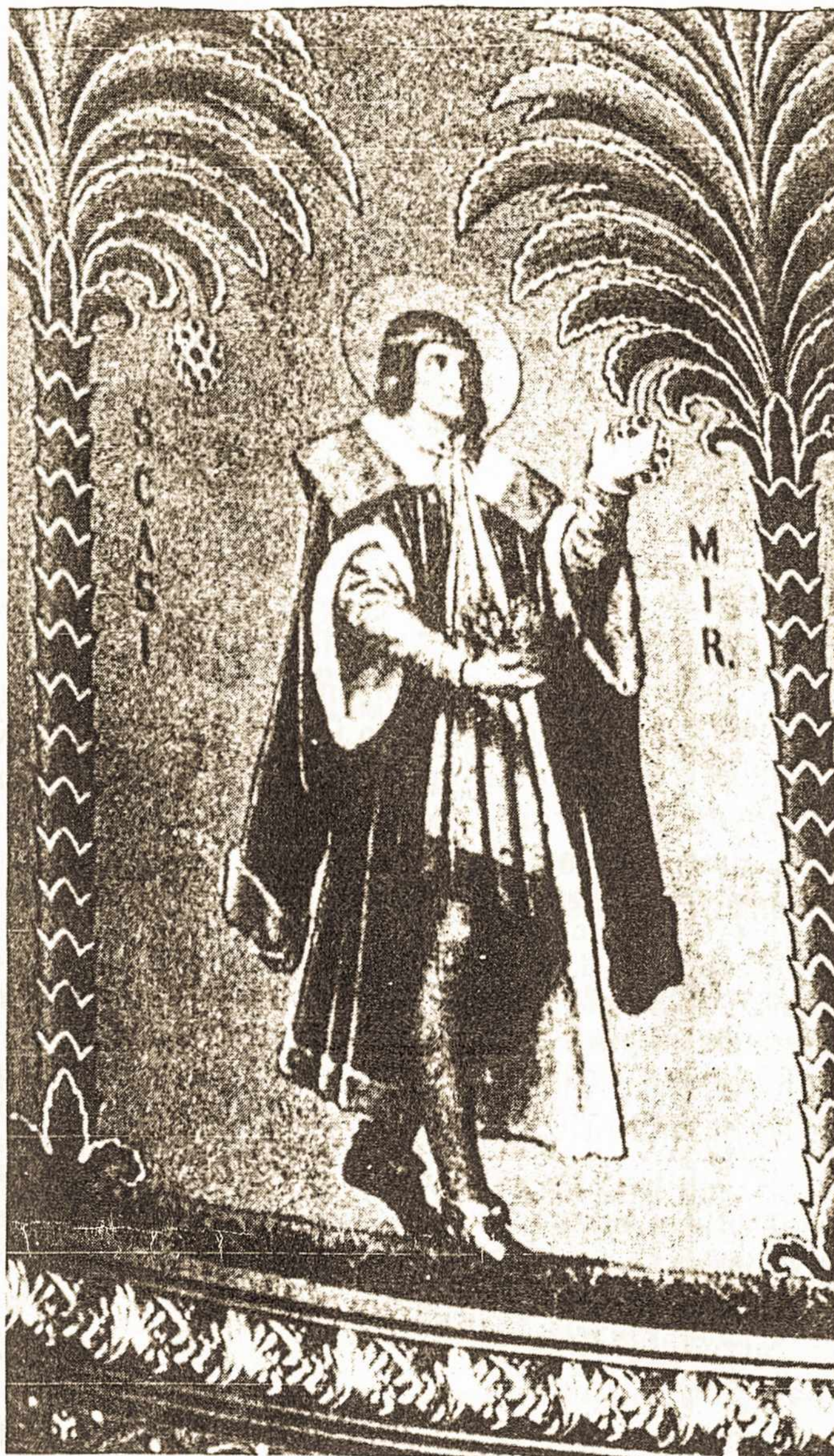
Šv. Kazimiero paveikslas Hohenschwangen pilies sienoje, Bavarijoje, Vokietijoje.

Kadangi Kazimieras šia kryptimi veikti, būtent, kurti dinastiją ar ją plėsti palinkimo, nerodė, tai Krokuvą per daug nesigailėjo, kai karalaitis persikėlė į Vilnių ir čia atsidėjo biurokratiniam darbui, tvarkydamas Lietuvos Didžiosios Kunigaikštijos finansus.